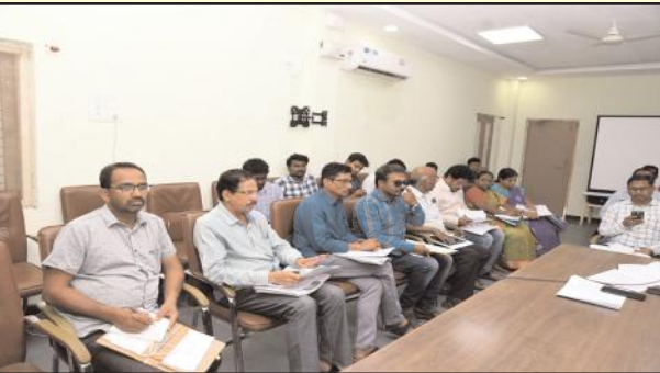
సమావేశంలో పాల్గొన్న అధికారులు

భవనాలు, అంగన్వాడీ భవనాలు, మన ఊరు మనబడి పనులపై ఇంజనీరింగ్, విద్యాశాఖ, శిశు సంక్షేమ శాఖల అధికారులతో సమీక్ష సమావేశం నిర్వహించారు. ఈ సందర్భంగా జిల్లా అదనపు