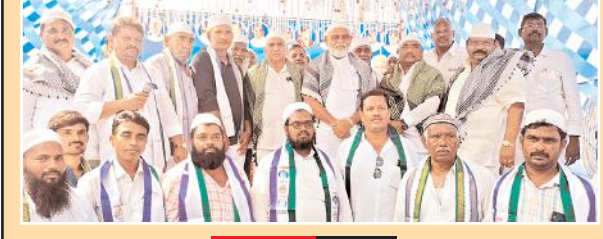
వివరాలు 8 లో

కాంగ్రెస్ నుంచి వైయస్సార్సీపీలోకి చేరిన ముస్లిం కుటుంబాలు ఎన్నికల సమయంలో చేరటం కొత్త ఉత్తేజానిస్తుంది కష్టపడి పని చేస్తే పార్టీలో సముచిత స్థానం రాష్ట్ర జలవనరుల శాఖామంత్రి అంబటి రాంబాబు