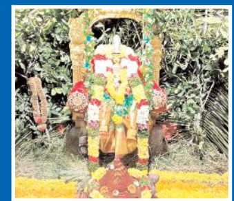
వివరాలు 8 లో