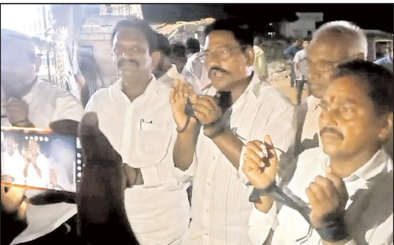
నేటి దినపత్రిక సూర్య బ్యూరో, పల్నాడు జిల్లా చంద్రబాబు అరెస్టుకు నిరసనగా తెలుగుదేశం పార్టీ పిలుపుమేరకు చేపట్టిన న్యాయానికి సంకెళ్లు కార్యక్రమంలో భాగంగా ఆదివారం రాత్రి పల్నాడు జిల్లావ్యాప్తంగా టిడిపి నేతలు చేతులుగా సంకెళ్లు వేసుకుని నిరసన

కార్యక్రమాన్ని చేపట్టారు. చంద్రబాబును అక్రమంగా అరెస్ట్ చేశారని, ప్రభుత్వం ఆధర్యంగా ప్రవర్తిస్తోందని వారు దుయ్య పట్టారు. వైసిపి చేస్తున్న చర్యలకు తగిన మూలిన చెల్లించుకుంటుందన్నారు. వచ్చేది తెలుగుదేశం ప్రభుత్వమేనని అధికారుల పక్షపాతం విడనాడా అన్నారు. 40వేళ్ల రాజకీయ ప్రస్థానంలో చంద్రబాబు ఎలాంటి దుర్మార్గం చేయలేదని, కావాలని వైసిపి నేతలు ఇలాంటి కట్టుకథలు అన్నీ ఆయన జైలు పాలు చేశారన్నారు. చివరికి ధర్మమే గెలుస్తుంది అన్నారు. ఆయన ఇబ్బందులు పాలు చేయడానికి అనేక పీటి వారంట్ వేస్తున్నారు అన్నారు. 74వేళ్ల వయసులో ఆయన ఇబ్బందులకు గురి చేస్తున్నారని, ఆయన ఆరోగ్యం క్షేమించే విధంగా వ్యవహరిస్తున్నారని వారు ఆందోళన వ్యక్తం చేశారు. వైసిపి ప్రభుత్వం ఇలాగనే వ్యవహరిస్తే ఉద్యమాన్ని ఉద్యతం చేస్తామని హెచ్చరించారు. ఇకనుంచి ప్రజా క్షేత్రంలోని తేల్చుకుంటామని మిగతాది 4లో..