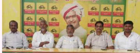
తెలుగుదేశం పార్టీ కార్యాలయం యన్.టి.ఆర్ భవన్ - సత్తెనపల్లి