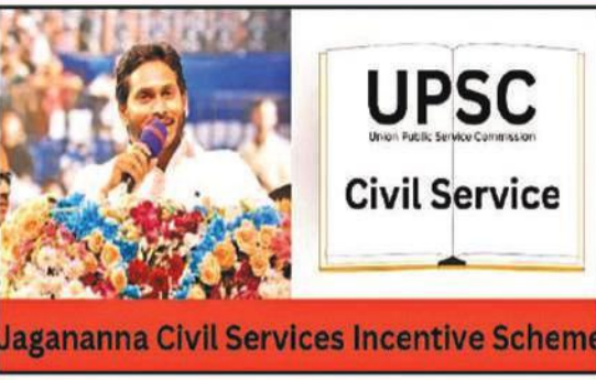
Jagananna Civil Services Incentive Scheme