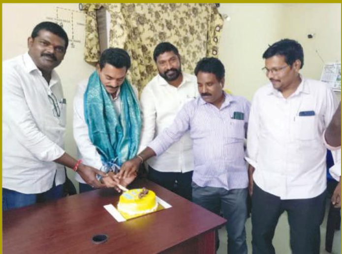
నేటి దినపత్రిక సూర్య 17వ వార్షికోత్సవం సందర్భంగా గుంటూరు సూర్య కార్యాలయంలో శనివారం కేక్ కట్ సూర్య యాజమాన్యం, సిబ్బంది...