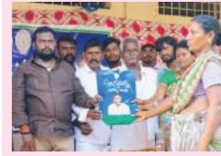
ప్రజలందరికీ జగనన్న ఆరోగ్య సురక్ష ..3లో