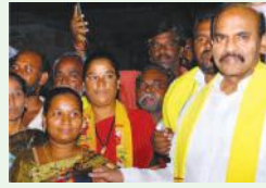
చంద్రబాబు అంటే సంక్షేమం, సంతోషం.. 3లో