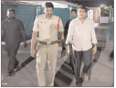
మంగళగిరి, మేజర్ న్యూస్: మంగళగిరి రాష్ట్ర

పవన్ కళ్యాణ్ భద్రత సేపద్ధ్యంలో పోలీసులకు ఫిర్యాదు చేసిన నాయకులు