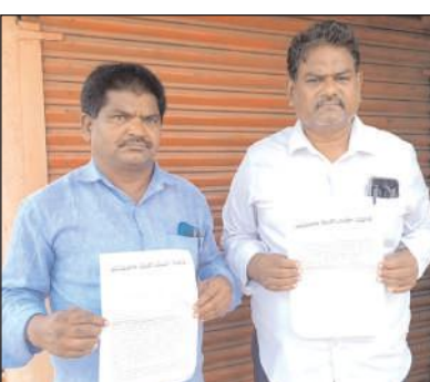
ఒలియల కలిసి రావాలని పిలుపునిచ్చారు.