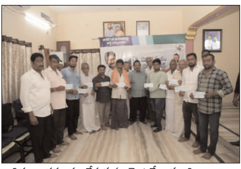
బాధితులు దరఖాస్తు చేసుకున్న వెంటనే లక్షలాది రూపాయలు విడుదల చేశారని చెప్పారు దరఖాస్తు