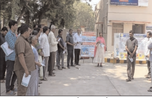
విధంగా సిబ్బంది ప్రయత్నం చేయాలని కోరారు. సంస్థకు కార్గో ఆదాయము చాలా ముఖ్యమని