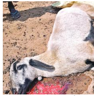
ఆంధ్రాక్స్ వ్యాధితో మృతి చెందిన గొర్రె