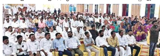
హాజరైన పార్టీ నాయకులు