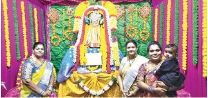
గజలక్ష్మి దేవి అలంకారంలో శ్రీ వాసవి కన్యకా పరమేశ్వరి దే

మంచి విషయాలు నేర్చుకోవలసి వుందని, గురువు తర్వాత సీనియర్స్ ను కూడా అదే స్థాయిలో భావించాలన్నారు. విద్యార్థులు స్కీల్ డెవలప్మెంట్ చేసుకోవాలని, మంచి స్థాయిలో స్థిరపడాలని ఆకాంక్షిస్తూ తల్లి దండ్రులు తమ భవిష్యత్ పై పెట్టుకున్న ఆశలను వమ్ము చేయకుండా చూడాలన్నారు. అనంతరం ఫ్రైషర్స్ సందర్భంగా విద్యార్థులు సాంస్కృతిక కార్యక్రమాలు నిర్వహించారు.