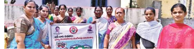
గ్రామంలో ర్యాబీ నిర్వహిస్తున్న అంగన్వాడీ కార్యకర్తలు, మహిళలు