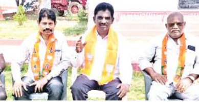
సమావేశంలో మాట్లాడుతున్న బిజెపి నాయకుడు

కష్టాన్ని దోచుకోవడమే కాకుండా వారిని అనారోగ్యం పాలవుతూ వారి కుటుంబాల నాశనం అవుదానికి మీరు మా రాష్ట్ర అధ్యక్షులు శ్రీమతి దగ్గుపాటి పురందేశ్వరి డిమాండ్ చేసినట్లుగా మీరు మద్యం తయారీ దారుల పేర్లు బయటపెట్టే ధైర్యం ఉన్నదా సిబిఐ ఎంకైర్సీకి మీరు సిద్ధంగా ఉన్నారా రాష్ట్రంలో ఒక సర్వే ప్రకారం జాతీయ నగటును 23 శాతం మంది మద్యం సేవిస్తున్నారు ఈ రాష్ట్ర జనాభా బదు కోట్ల అయితే సుమారు 80 లక్షల మంది మద్యం సేవిస్తున్నారు ఒక్కొక్క తలపైన రెండు వందల రూపాయలు ఆదాయం వస్తే రోజుకి ఎంత ఆదాయం వస్తున్నది నెలకి ఎంత ఎన్ని లక్షలు వస్తున్నది సంవత్సరానికి ఎన్ని కోట్ల రూపాయలు ఆదాయం వస్తున్నది ఈ డబ్బులతో ఎక్కడికి వెళుతున్నది మీరు ప్రజలకు సమాధానం చెప్పాలి రాష్ట్రంలో శాంతి భద్రతలు పూర్తిగా విఫలమైనాయి ఏ ఒక్క వర్గం ప్రజలు సంతోషంగా లేరు రాష్ట్రంలో రైతులు నిరుద్యోగులు