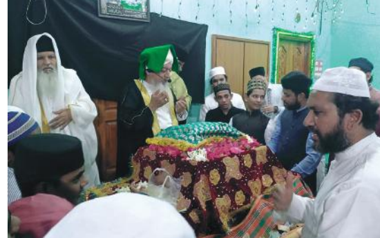
-ఘనంగా గార్లీ షరీఫ్ పండుగ -1000 మంది భక్తులకు అన్నదానం..