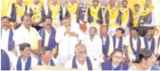
రిలే నిరాహార దీక్షలో మాట్లాడుతున్న కోట్ల