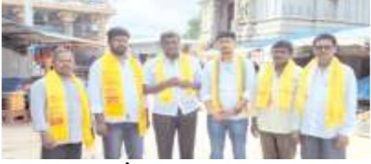
బ్రహ్మాంగారిమఠంలో పూజ నిర్వహించి బయటకు వస్తున్న దృశ్యం

అక్షగడ్డ, మేజర్ న్యూస్ : విశ్వబ్రాహ్మణ బీసీ సాధికార సమితి తెలుగుదేశం పార్టీ పిలుపుమేరకు మాజీ మంత్రివర్గులు భూమా