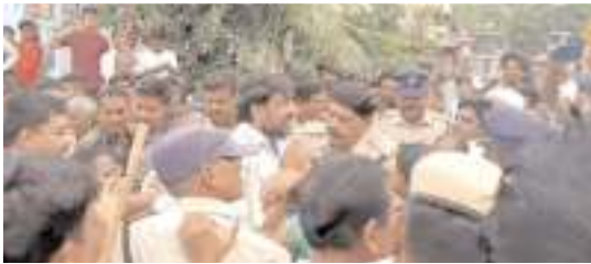
భూమాను అదుపులోకి తీసుకుంటున్న పోలీసులు

అధికారులు, తర్వాత మున్సిపల్ అధికారులు, చివరగా రోడ్డు భవనాల శాఖ అధికారులు అక్కడికి చేరుకున్నారు. మంచి నిద్రలో ఉన్న బొగ్గులైన్ నివాసులపై అధికార యంత్రాంగం ఉక్కుపాదం మోపింది. బొగ్గులైన్ లోని దుకాణాలను కూల్చివేసి ప్రక్రియను మొదలు పెట్టారు. బాధితులు అడ్డుకునే ప్రయత్నం చేశారు. విషయం తెలియడంతో మాజీ ఎమ్మెల్యే భూమా బ్రహ్మానందరెడ్డి అక్కడికి చేరుకొని బాధితుల పక్షాన నిలిచారు. కూల్చివేతను అడ్డుకున్నారు. పోలీసులు ఆయనను పోలీసుస్టేషన్ కు తరలించారు. పేదలకు పట్టాలు ఇచ్చి మౌళిక వసతులను కల్పించిన తర్వాత తొలగించాలని భూమా డిమాండ్ చేశారు. భూమాను అదుపులోకి తీసుకోవడంతో బాధితులు, టీడీపీ శ్రేణులు స్టేషన్ కు చేరుకొని స్టేషన్ ఎదుట ధర్నాకు దిగారు. పట్టాలు ఇచ్చారని, అక్కడ రోడ్డు లేవని ప్రస్తుతం ఆ స్థలాల్లో పంటల సాగు చేస్తున్నారని బాధితులు ఎక్కడికి వెళ్లాలని అధికార యంత్రాంగంతో భూమా వాదనకు దిగారు. నాలుగు రోజులు గడువు ఇస్తున్నట్లు అధికారులు హామీ ఇచ్చారు. ప్రత్యామ్నాయ మాధ్యం చూపించిన తర్వాతనే ఖాళీ చేయాలని లేని పక్షంలో బాధితుల పక్షాన నిలబడతామని భూమా హామీ ఇచ్చారు. దీంతో