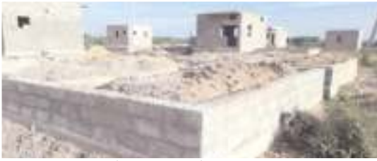
జగన్న కాలనీలో బేస్మెంట్ దశలో ఆగిపోయిన గృహ నిర్మాణాలు

వదిలేశారు. దాంతో నిర్మాణాలు ఆర్థాంతరంగా ఆగిపోయాయి. నిర్మాణాలు ఆగిపోయి నెలల గడుస్తున్నా