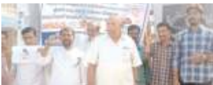
నిరసన తెలుపుతున్న దృశ్యం

కర్నూలు సిటీ, మేజర్ న్యూస్: అమరజీవి పొట్టిశ్రీరాములు ఆత్మార్పణ స్ఫూర్తితో అవశేష ఆంధ్రప్రదేశ్ రాష్ట్ర అవతరణ దినోత్సవాన్ని అక్టోబర్ 1వ తేదీన నిర్వహించాలని రాయలసీమ విద్యావంతుల వేదిక డిమాండ్ చేశారు. ఆదివారం