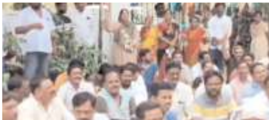
స్టేషన్ ఎదుట బాధితుల ధర్నా

బాధితులు ధర్నాను విరమించారు. వివరాల్లోకి వెళ్తే... బొగ్గులైన్ ప్రాంతంలో పొరంబోకు స్థలాల్లో పేదలు గుడిసెలు వేసుకొని ఎన్నో ఏళ్లు నుంచి నివాసం ఉంటున్నారు. ఆ