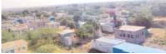
పుణరావాసాలు పూర్తి కాని ఒక గ్రామం

నాడు వరద చేసిన గాయానికి ఉన్న ఇళ్లు కొట్టుకుపోయి బతుకు జీవితా అంటూ వలన పట్టిన జనం నేటికీ ఇంటి వసతులు లేక వలన వెళ్లిన పక్షలం ఎన్నడు ఊరు చేరుకుంటామో అని పుష్కరకాలంగా ఎదురు చూస్తూనే ఉన్నారు.. సమీపంలోని గ్రామాల్లో కొందరు తల దాచుకుంటు ఉంటే.. కొందరు బతుకులు బారమై పట్టణాలకు చేరుకుని చిద్రమైన బతుకులను నడుపుకుంటున్నారు.. అడ్డెలు బారెడు అయిన తప్పని సరిగా జీవన సాగించే ధిశలో అష్ట కష్టాలకు లోనౌతున్నారు. ఇక నందవరం మండలంలో నడికైరవాడి గ్రామంలో భూ సమస్య పరిష్కారం జరగలేదు.. నాగులదిన్నె గ్రామంలో పుణరావాస కాలనీలో పూర్తి కాని ఇళ్ల కారణంగా చేనేత కార్మికుల బతుకులు వర్షనాతీతంగా మారాయి.. ఇలా 12 ఏళ్లగా ఇలా వరద బాధితులు పడుతున్న అవస్థలను తీర్చేందుకు పాలకులు ఇప్పటికైనా చర్యలు చేపడతారని వేచిచూద్దాం..