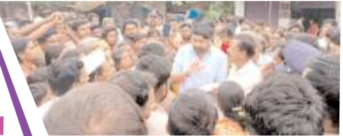
అధికారులతో మాట్లాడుతున్న భూమా