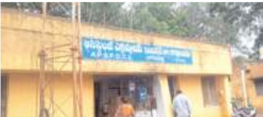
శిథిలావస్థకు చేరిన చేరిన విద్యుత్తు కార్యాలయం

చాగలమర్రి, మేజర్ న్యూస్ : స్వాతంత్రం వచ్చిన రోజుల్లో నిర్మించినటువంటి భవనాలు నేటికీ వివిధ కార్యాలయాల రూపంలో మండలంలో విధులు నిర్వహిస్తున్న భవనాలు ఉన్నాయి. ఆ భవనాలకు కాలం చెల్లిన చేసింది ఏమీ లేక విధులు నిర్వహిస్తున్నారు. కార్యాలయాల్లో తమ విధులను నిర్వహించాలంటే ప్రాణాలను అరచేతిలో పెట్టుకొని విధులు నిర్వహించాల్సింది. ఈ వైనం మండల కేంద్రమైన చాగలమర్రిలో దర్శనము ఇస్తాయి. నిత్యం ప్రజలతో అవసరమయ్యే విద్యుత్ కేంద్రము ఎప్పుడో 60 సంవత్సరాల కిందట నిర్మించిన పరిపాలనా భవనంలో ఇప్పటికీ విధులను కొనసాగిస్తున్నారు. భవనం శిథిలావస్థకు చేరినప్పటికీ రేపొ మో భవనం కూలిపోయిన ఆశ్చర్య పోవాల్సిన అవసరం లేదు. మండల కేంద్రమైన చాగలమర్రిలోని విద్యుత్ సబ్స్టేషన్ వద్ద ఉన్న పరిపాలనా భవనం పెచ్చులూడి పడుతున్న అందులో పని చేసే విద్యుత్ అసిస్టెంట్ ఇంజనీర్, మరియు సిబ్బంది తమ ప్రాణాలను లెక్కచేయకుండా విధులను కొనసాగిస్తున్నారు. ప్రస్తుత ప్రభుత్వ విద్యా వైద్యం కోసం, సచివాలయాల భవనాల కోసం కోట్లాది రూపాయలు ఖర్చు చేస్తున్నప్పటికీ, మండల కేంద్రంలో నిత్యం ప్రజల అవసరాలకు