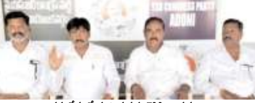
సమావేశంలో మాట్లాడుతున్న వైసిపి నాయకులు