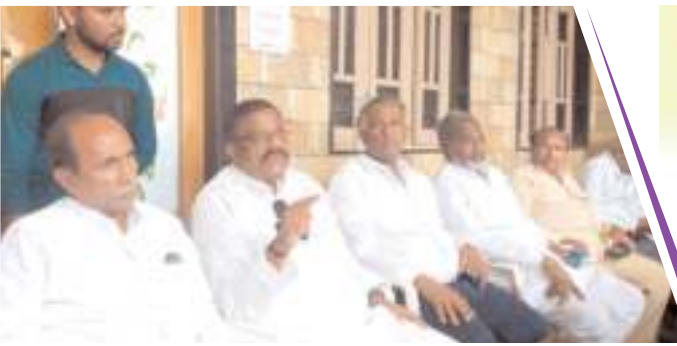
సమావేశంలో మాట్లాడుతున్న కేంద్ర మాజీ మంత్రి కోట్ల