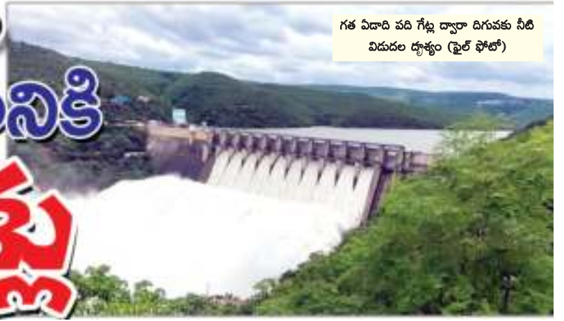
గత ఏడాది పది గేట్ల ద్వారా దిగువకు నీటి విడుదల దృశ్యం (ఫైల్ ఫోటో)