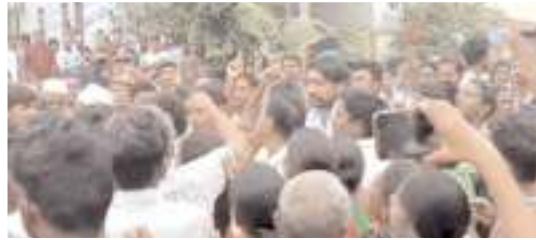
భూమా అరెస్టును అడ్డుకుంటున్న బాధితులు

ఇచ్చారు. అందులో గడువును పొందు పరచి ఆ లోగా ఖాళీ చేయాలని అధికారులు ఆదేశాలిచ్చారు. గడువు ముగిసిన బాధితులు ఖాళీ చేయకపోవడంతో అధికారులు