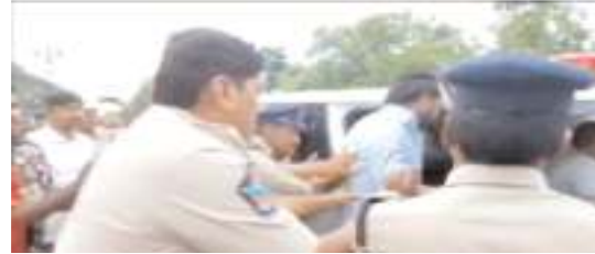
భూమాను వాహనంలో తరలిస్తున్న పోలీసులు