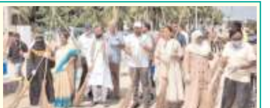
చెత్తను శుభ్రం చేస్తున్న దృశ్యం