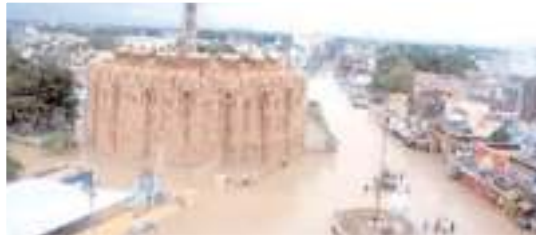
ప్రభుత్వాలకు కనికరం కనిపించడంలేదు.