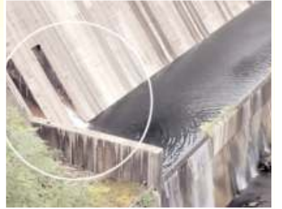
స్ట్రాయిక్ గేట్ ద్వారా వృధాగా పోతున్న నీరు

కర్నూలు వరద కష్టాలకు నేటికి 14 ఏళ్లు, అక్టోబరు 2, 2009లో అనూహ్యంగా వచ్చిన వరదనీరు జనజీవనాన్ని అతలాకుతలం చేసింది. కృష్ణా, తుంగభద్ర, హంద్రీ, కుందూ నదులన్నీ కలిసి ఉప్పొంగి కర్నూలును ముంచెత్తాయి. నగరంలోనే లక్ష కుటుంబాలు సర్వం కోల్పోయాయి. రెండు రోజులు ప్రజలు ఇళ్ల పైభాగంలోనే ఉండాలని వచ్చింది. శ్రీశైలం డ్యాం నిర్మాణానికి 1963లో శంకుస్థాపన చేసి 1984లో జాతికి అంకితం చేశారు. డ్యాంకు రెండు సార్లు భారీ వరద తాకింది. 1999లో ఒకసారి 2009లో మరొకసారి అతి భారీ వరద వచ్చింది. 2009 సంవత్సరంలో శ్రీశైలం డ్యాంకు వచ్చిన భారీ వరద కారణంగా కుడిగట్టు జల విద్యుత్ కేంద్రం, లింగాలగట్టు మత్స్యకార గ్రామం నీట మునిగాయి. వరదల సంభవించి నేటికి 14 ఏళ్లు గడుస్తున్న మత్స్యకారులు పక్క గృహానికి నోచుకోలేదు. శ్రీశైలం డ్యాంకు 2009 అక్టోబర్ 2 వరదలపై సూర్య ప్రత్యేక కథనం..... మిగతా 2లో