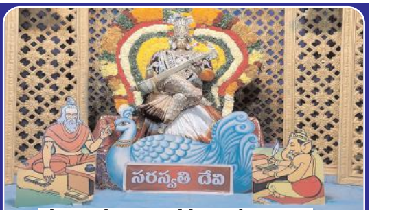
శ్రీ సరస్వతి దేవి ఆలంకరణలో శ్రీశృంఖలాదేవి అమ్మవారు