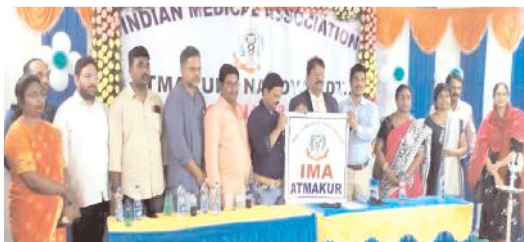
మెడికల్ అసోసియేషన్ కమిటీని ఎన్నుకుంటున్న దృశ్యం

-వైద్యులంతా కలిసి ఉంటేనే సమస్యల పరిష్కారం - నూతన వైద్యుల అసోసియేషన్ ఏర్పాటు