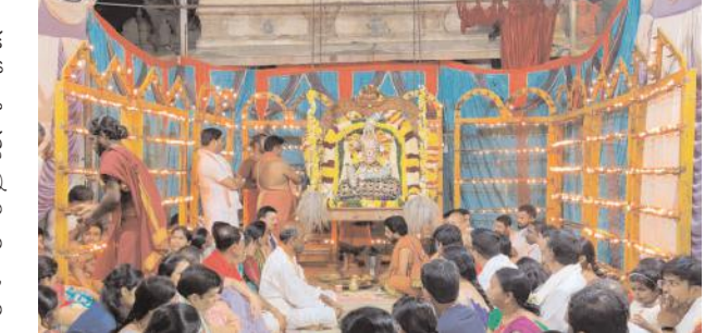
సహస్ర దీపాలంకరణ సేవలో మీనాక్షి అమ్మవారు