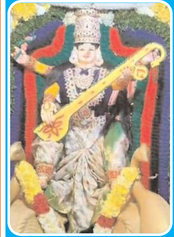
కోదండరామాలయంలో శ్రీ సరస్వతి ఆలంకరణలో అమ్మవారు