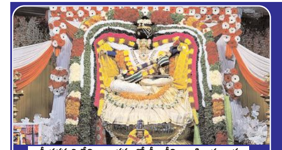
శ్రీ సరస్వతి దేవి ఆలంకరణలో శ్రీకాశివిశాలాక్షి అమ్మవారు