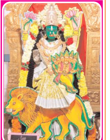
శ్రీ సుందమాత ఆలంకరణలో శ్రీలక్ష్మీదేవి అమ్మవారు

దర్శనం ఇవ్వగా, రోజాకుంటలో వెలసిన శ్రీగణపతి నాగలింగేశ్వర వెంకటేశ్వర స్వామి ఆలయంలో అమ్మవారు శ్రీ సరస్వతి ఆలంకరణలో దర్శనం. నందమూరినగర్ కోదండ రామాలయంలో అమ్మవారు శ్రీ సరస్వతి ఆలంకరణలో దర్శనమిచ్చారు. ఉప్పలిపేటలో భక్తులు ఏర్పాటు చేసిన ప్రత్యేకంగా అమ్మవారి విగ్రహాన్ని ఏర్పాటు చేయగా అమ్మవారు సరస్వతి ఆలంకరణలో దర్శనమిచ్చారు. తెలుగుపేటలో వెలసిన శ్రీమద్దులేటి లక్ష్మీనృసింహస్వామి ఆలయంలో శ్రీలక్ష్మీదేవి అమ్మవారు శ్రీ సుందమాతగా దర్శనమిచ్చారు. ప్రపంచంలో రెండో ఆలయంగా ప్రసిద్ధి చెందిన శ్రీజగజ్జనని ఆలయంలో అమ్మవారు భక్తులకు దర్శనం ఇస్తూ పూజలందుకుంటున్నారు. భక్తులు వేలాదిగా తరలివస్తూ కుంకు మార్చనలు చేశారు. పట్టణంలోని ఆత్మకూరు బస్టాండ్ సమీపంలో వెలసిన శ్రీనిమిషాంబ దేవాలయంలో అమ్మవారికి శ్రీఆర్యక్షత్రియ చిత్తారి సంఘం ఆధ్వర్యంలో ప్రత్యేక ఆలంకరణ చేశారు. గిరినాథ్ సెంటర్లో ఏర్పాటు చేసిన దుర్గామాత భక్తులకు దర్శనం ఇచ్చారు. ఆయా రూపాల్లో ఉన్నజగదాంబకులార్చకులు ఇష్టమైన నైవేద్యం సమర్పించగా, సంజీవనగర్ కోదండ రామాలయంలో శ్రీకాశివిశ్వేశ్వర స్వామి, శ్రీకాశివిశాలాక్షి అమ్మవార్లకు దాతలు ప్రత్యేక వసూలను తీసుకుని వచ్చారు. ఆలయాల్లో భక్తులకు తీర్థప్రసాదాలను ఏర్పాటు చేశారు.