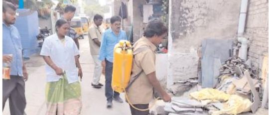
దోమల వ్యాప్తి చెందకుండా మందు పిచికారీ చేస్తున్న దృశ్యం

కర్నూలు నగరం, మేజర్ న్యూస్: నగరంలో పలు కాలనీల్లో నీరు నిల్వ, మురికికాలువలు శుభ్రం చేయడంతోపాటు చుట్టూ పక్కల పరిసరా లను శుభ్రంగా ఉంచుకుంటే రోగాలు దరి చేరకుండా ఉంటా యన్నారు. ఈ కార్యక్రమంలో నగర పాలక సిబ్బంది పాల్గొన్నారు.