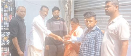
భాధితులకు 10వేల రూపాయలు అందజేస్తున్న వైకాపా నాయకులు