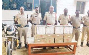
మద్యం బాకర్లు స్వాధీనం చేసుకున్న పోలీసులు