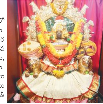
మహాసరస్వతి అలంకరణలో అమ్మవారు

కర్నూలు టౌన్, మేజర్ న్యూస్ : నగరంలోని శ్రీ సూర్యనారాయణస్వామి ఆలయంలో దసరా ఉత్సవాలు ఘనంగా జరుగుతున్నాయి. శుక్రవారం అమ్మవారు మహాసరస్వతిదేవి అలంకరణలో భక్తులకు దర్శనమిచ్చారు. అమ్మవారికి విశేష అభిషేకం, అర్చనలు నిర్వహించారు. ఖడ్గమాల, లలిత సహస్రనామాలతో అర్చన చేశారు. అనంతరం చండీహోమం నిర్వహించారు. భక్తులు అధిక సంఖ్యలో పాల్గొని అమ్మవారికి పూజలు నిర్వహించారు. అనంతరం ప్రసాదం పంపిణీ చేశారు.