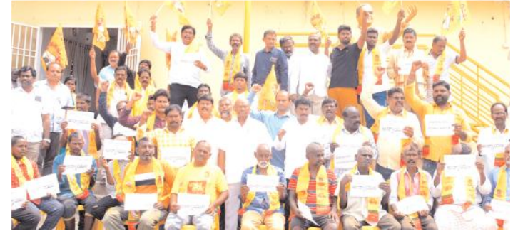
నిరసన తెలుపుతున్న టిడిపి నాయకులు