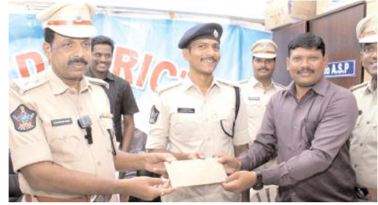
రివార్డులు అందజేస్తున్న దృశ్యం