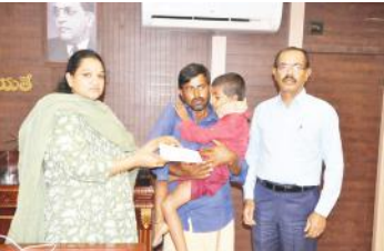
ఆర్థిక సాయం అందజేస్తున్న జిల్లా కలెక్టర్

విధంగా చర్యలు తీసుకుంటామని, అలాగే ఉద్యోగాలు అడిగిన వారికి ఉపాధి కల్పన దిశగా అవకాశాలు కల్పించేందుకు దృష్టి పెట్టామని కలెక్టర్ వివరించారు.