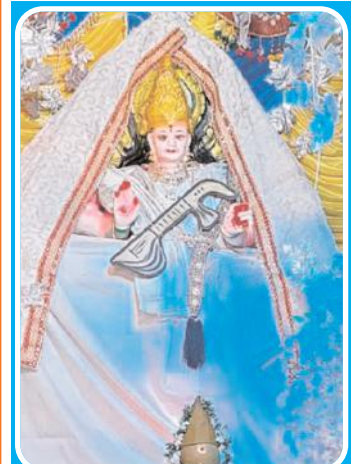
శ్రీ సరస్వతిదేవి ఆలంకరణలో శ్రీకాళికాంబ అమ్మవారు

వల్లిగా..మనోభీష్టాలనుతీరుస్తూ పూజలందు కుంటూ వివిధ రూపాల్లో అమ్మవారు భక్తులకు దర్శనం ఇస్తున్నారు. శోభకృత్ నామ సంవత్సరం దక్షిణాయణం శరత్ రతువు అశ్వీయుజ మాసం శుక్లపక్షం షష్ఠి పురస్కరించుకుని పట్టణంలోని ఆలయాల్లో అమ్మవారిని ప్రత్యేకంగా ఆలంకరించారు. ఆలయాలు