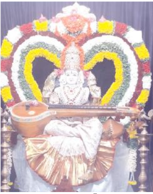
కల్లూరు వాసివి టెంపుల్ అమ్మవారు శ్రీ రాజేశ్వరిదేవిగా భక్తులకు దర్శనం