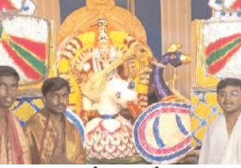
మహా సరస్వతి దేవి అలంకారంలో వాసవీ మాత