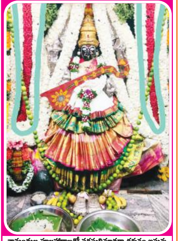
చామంతుల పూజారాలతో సరస్వతిమాతగా దర్శనం ఇస్తున్న శ్రీకాళికాంబ మాత మూలవిరాట్