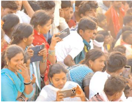
రామాంజనేయులు ముగ్గురు కుమారులు, ఒక కూతురు. తమ తాతలది నెరనికి గ్రామం కావడంతో