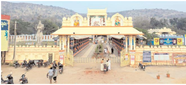
మహానంది ఆలయ దృశ్యం