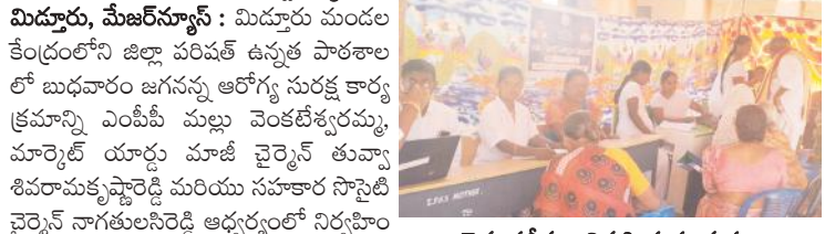
వైద్య పరీక్షలు నిర్వహిస్తున్న ధ్యేయం