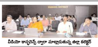
వీడియా కాన్ఫరెన్స్ ద్వారా మాట్లాడుతున్న డిల్లీ కలెక్టర్