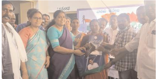
కృష్ణగిరి, మేజర్ న్యూస్ :

ప్రజల ఆరోగ్య పరిరక్షణ ధ్యేయంగా తమ ప్రభుత్వం పని చేస్తుందని