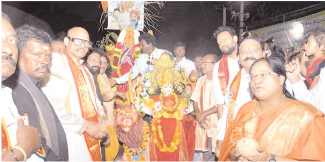
దుర్గామాతకు పూజలు నిర్వహిస్తున్న దృశ్యం