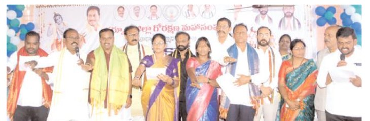
ప్రమాణ స్వీకారం చేస్తున్న దృశ్యం

గోశాలలో ఈ ప్రమాణస్వీకార కార్యక్రమం జరిగింది. ఈ కార్యక్రమానికి కర్నూలు ఎంపీ సంజీవకుమార్, కర్నూలు ఎమ్మెల్యే హాఫీజ్ ఖాన్, మేయర్ బి.వై.రామయ్య, విశా 2లో