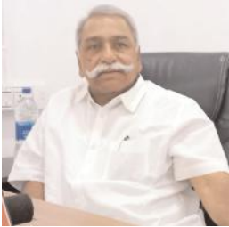
మాట్లాడుతున్న మాజీ ఎంపీ గంగుల ప్రతాపరెడ్డి

ఆళ్లగడ్డ మేజర్ న్యూస్ : మన ప్రాంతంలో సాగునీటి సమస్య పెద్దగా కనపడుతోంది పంటలను సాగు చేసే రైతులు ఆంధోళనలో ఉన్నారని వారికి భరోసానిచ్చాల్సిన బాధ్యత అధికారులు