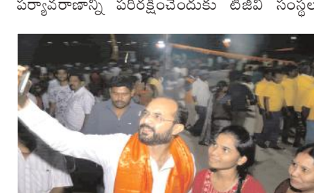
మహిళలతో సెల్ఫీలు దిగుతున్న నగర ఎమ్మెల్యే హాఫీజ్ ఖాన్