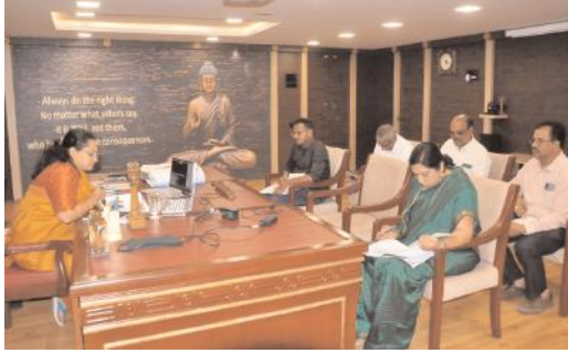
వీడియో కాన్ఫరెన్స్లో మాట్లాడుతున్న కలెక్టర్ జి.నృజన

- జిల్లా కలెక్టర్ జి.నృజన కర్నూలు, మేజర్ న్యూస్ ప్రతినిధి : రీ సర్వేకు సంబంధించి మండలాల వారిగా నిర్దేశించిన లక్ష్యాలను సాధించే దిశగా చర్యలు తప్పవని జిల్లా కలెక్టర్ జి.నృజన అన్ని మండలాల తహసీల్దార్లను, సర్వేయర్లను ఆదేశించారు. బుధవారం కలెక్టర్ క్యాం కార్యాలయం