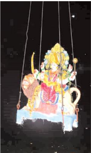
గంగమ్మ చెంతకు చేరుతున్న దుర్గమ్మ