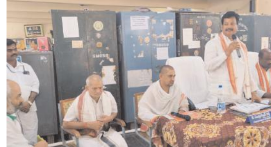
దేవస్థానం కార్యాలయంలో మాట్లాడుతున్న ఈఓ