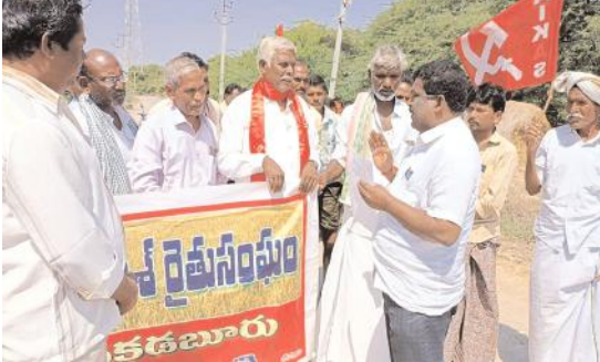
విద్యుత్ సబ్ స్టేషన్ ఎదుట ధర్నా నిర్వహించిన ఎపి రైతు సంఘం నాయకులు