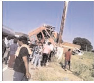
ప్రమాదానికి గురైన లారీలు, కారు

ప్యాసిలి, మేజర్ న్యూస్: మండల పరిధిలోని పోతుదాడి గ్రామం స్టేజి వద్ద 44వ నెంబర్ జాతీయ రహదారిపై బుధవారం ఒక లారీ పంక్లర్ అయింది. అయితే వెనుకాల వస్తున్న మరో లారీ ఎదురుగా ఉన్న లారీని గమనించకుండా లారీడ్రైవర్ ఆగి ఉన్న లారీని ఢీకొన్నాడు. ఇది ఇలా ఉంటే ఈ రెండు లారీలు ప్రమాదానికి గురైన మరికొద్దినీ పటికే మరొక్క లారీతో పాటు ఒక ట్రక్కు కూడా ఒకదానికొకటి ఢీకొన్నాయి. అయితే ఈ ప్రమాదంలో ఒక కారు కూడా ప్రమాదానికి గురైంది. దీంతో నాలుగు లారీలు, ఒక కారు ప్రమాదానికి గురైయ్యాయి. ఈ ప్రమాదంలో స్వల్పగాయాల తప్పా