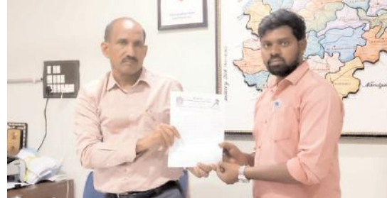
వినతిపత్రం అందజేస్తున్న దృశ్యం