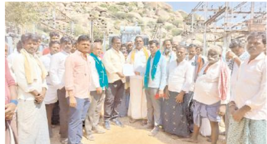
వినతిపత్రం అందజేస్తున్న సిపిఎం నాయకులు, రైతులు