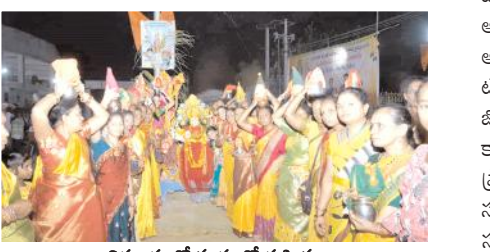
నిమజ్జనంలో కలశలతో మహిళలు