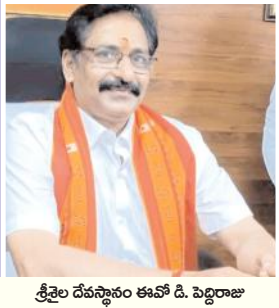
శ్రీశైల దేవస్థానం ఈవో డి. పెద్దిరాజు