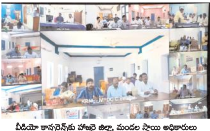
వీడియో కాన్ఫరెన్స్ కు హాజరై జిల్లా, మండల స్థాయి అధికారులు