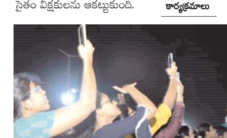
నిమజ్జన దృశ్యాలను సెల్ఫోన్లలో బంధిస్తున్న యువకులు