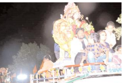
నిమజ్జనానికి తరలివెళ్తున్న దుర్గామాత విగ్రహాలు