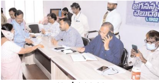
వినతులు స్వీకరిస్తున్న దృశ్యం

కర్నూలు నగరం, మేజర్ న్యూస్: నగర పాలక సంస్థ 35వ వార్డు పరిధిలోని ముదిరాజ్ నగర్ కాలనీలో ఏర్పాటు చేసిన సెల్ టవర్ ను వెంటనే తొలగించాలని ఆ కాలనీ వాసులు డిమాండ్ చేశారని నగర కమిషనర్ భార్యవతేజ తెలిపారు. సోమవారం నగర పాలక కౌన్సిల్ హాల్ లో నిర్వహించిన స్పందన కార్యక్రమంలో ఆయన పాల్గొని ప్రజల నుంచి వినతులు స్వీకరించారు. ఈ సందర్భంగా కమిషనర్ మాట్లాడుతూ అశోక్ నగర్, సోమిశెట్టి నగర్, కల్లూరు వంటి కాలనీల్లో నీటి సరఫరా సక్రమంగా లేదని, ఆ సమస్యను సత్వరమే పరిష్కరించాలని ఆయా కాలనీల వాసులు కోరినట్లు తెలిపారు. అలాగే మారుతినగర్, గీతానగర్ లో ఉన్న పార్కును అభివృద్ధి చేయాలని ఆ కాలనీ వాసులు కోరినట్లు తెలిపారు. గీతానగర్ లో డ్రైనేజీ సమస్య ఎక్కువగా ఉందని, సమస్యను పరిష్కరించి ప్రజల