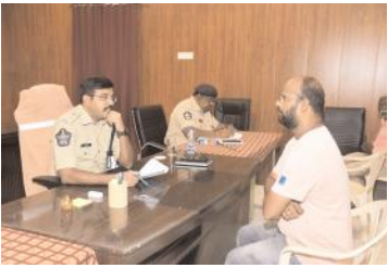
వినతులు స్వీకరిస్తున్న జిల్లా ఎస్పీ జి.కృష్ణకాంత్

కర్నూలు క్రైమ్, మేజర్ న్యూస్ : స్పందన కార్యక్రమం ద్వారా స్వీకరించిన ఫిర్యాదులపై త్వరితగతిన స్పందించి పరిష్కరించాలని జిల్లా ఎస్పీ జి.కృష్ణకాంత్ పోలీసు అధికారులను ఆదేశించారు. సోమవారం నగరంలోని ఎస్పీ కార్యాలయంలో జిల్లా ఎస్పీ స్పందన కార్యక్రమం నిర్వహించారు. జిల్లాలోని వివిధ ప్రాంతాల నుంచి స్పందన కార్యక్రమానికి వచ్చిన