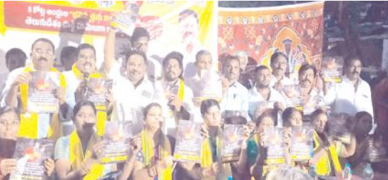
బాబుతో నేను పోస్టర్తో మహిళలు, టిడిపి నాయకులు