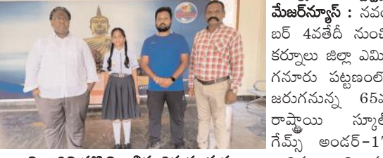
విద్యార్థిని హాని అభినందిస్తున్న దృశ్యం