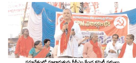
సమావేశంలో మాట్లాడుతున్న సిపిఎం కేంద్ర కమిటీ సభ్యులు