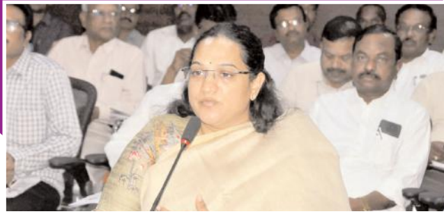
వీడియా కాన్ఫరెన్స్ లో మాట్లాడుతున్న జిల్లా కలెక్టర్