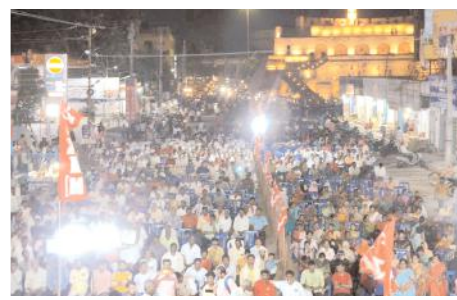
హాజరైన సిపిఎం నాయకులు

ప్రజల ప్రధాన సమస్యలను తెలుసుకునేందుకు చేపట్టినట్లు తెలిపారు. రాష్ట్రంలో రైతుల పరిస్థితి దారుణంగా ఉందన్నారు. విద్యుత్ మీటర్లకు స్కార్లు మీటర్లు పెట్టి రైతులపై భారాలు వేస్తుందన్నారు. రైతాంగ ఆత్మహత్యలు పెరుగుతున్నా పట్టించుకోవడం లేదన్నారు. దేశంలో, రాష్ట్రంలో పరిశ్రమలు మూత పడి యువతకు ఉద్యోగాలు లేక వలసలు వెళ్తున్నారన్నారు. కరోనా సమయంలో రైతులపై తెచ్చిన మూడు నల్ల చట్టాలకు వ్యతిరేకంగా 366 రోజులు ఉత్తర భారత దేశంలో రైతులు పోరాడి 700 మంది రైతులు బలిదానాలు చేసి వ్యతిరేకించారన్నారు. రాష్ట్రంలో పేదరికం, నిరుద్యోగం