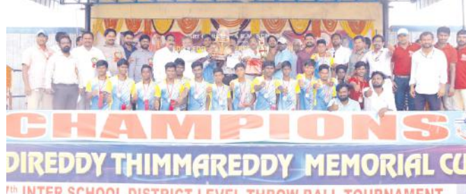
త్రోబాల్ క్రీడా విజేతలకు త్రోఫీ ప్రధానం చేసిన దృశ్యం

నంద్యాల కల్చరల్, మేజర్ న్యూస్ : నంద్యాల పట్టణంలోని ఎన్.జి.కాలనీలో ఉన్న శ్రీగురురాజ ఇంగ్లీష్ మీడియం పాఠశాల ప్రాంగణంలో నిర్వహించిన 7వ జిల్లాస్థాయి పెద్దిరెడ్డి తిమ్మారెడ్డి త్రోబాల్ బోర్డుమెంట్ విజేతలకు బహుమతి ప్రధానోత్సవం ఘనంగా నిర్వహించారు. కర్నూలు, నంద్యాల జిల్లా నలుమూలల నుంచి 108 బృందాలు పాల్గొన్నాయి బాలికల విభాగంలో ప్రథమ స్థానం గురురాజ ఇంగ్లీష్ మీడియం పాఠశాల, ద్వితీయ స్థానం గుడ్.పెప్పర్ పాఠశాల, తృతీయ స్థానం కర్నూలు విజ్ఞాన పీఠం, బాలర విభాగంలో ప్రథమ స్థానం గురురాజ ఇంగ్లీష్ మీడియం పాఠశాల,