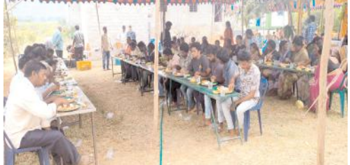
అన్నదాన కార్యక్రమంలో పాల్గొన్న భక్తులు

డోన్.నారాల్, మేజర్ న్యూస్: పట్టణంలోని ప్రభుత్వ డిగ్రీ కళాశాల నమీవంలో గల శ్రీ పోలికి వర చిదంబర స్వామి సన్నిధిలో శ్రీభరద్వాజ్ మాస్టర్ జయంతి వేడుకలను ఘనంగా నిర్వహించినట్లు సంస్థాన్ కమిటీ సభ్యులు సోమవారం తెలిపారు. ఈ