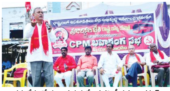
సమావేశంలో మాట్లాడుతున్న కేంద్ర కమిటీ సభ్యులు గృహర్

- వైసీపీ వచ్చాక రోడియజం మొదలైంది - కేంద్ర కమిటీ సభ్యులు గృహర్