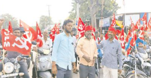
బైకు ర్యాలీనిర్వహిస్తున్న సిపిఎం నాయకులు