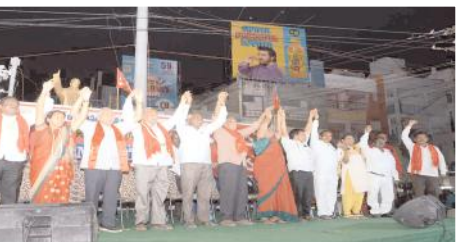
బక్కత చాటుతున్న సిపిఎం నాయకులు

ప్రజల ప్రధాన సమస్యలను తెలుసుకునేందుకు చేపట్టినట్లు తెలిపారు. రాష్ట్రంలో రైతుల పరిస్థితి దారుణంగా ఉందన్నారు. విద్యుత్ మీటర్లకు స్కార్లు మీటర్లు పెట్టి రైతులపై భారాలు వేస్తుందన్నారు. రైతాంగ ఆత్మహత్యలు పెరుగుతున్నా పట్టించుకోవడం లేదన్నారు. దేశంలో, రాష్ట్రంలో పరిశ్రమలు మూత పడి యువతకు ఉద్యోగాలు లేక వలసలు వెళ్తున్నారన్నారు. కరోనా సమయంలో రైతులపై తెచ్చిన మూడు నల్ల చట్టాలకు వ్యతిరేకంగా 366 రోజులు ఉత్తర భారత దేశంలో రైతులు పోరాడి 700 మంది రైతులు బలిదానాలు చేసి వ్యతిరేకించారన్నారు. రాష్ట్రంలో పేదరికం, నిరుద్యోగం