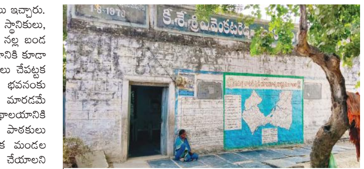
పెద్దకడుబూరు శాఖ గ్రంథాలయం శిథిలావస్థకు చేరుకున్న దృశ్యం

అభివృద్ధికి తమ వంతు సహకారం అందిస్తామని అనేక హామీలు ఇచ్చారు. కానీ ఇంత వరకు కార్యరూపం దాల్చిన దాఖలాలు లేవని స్థానికులు, పాఠకులు, తీవ్రంగా విమర్శిస్తున్నారు. అలాగే భవనం లోపల నల్ల బండ పరుపుతో పాటు భవనం చుట్టూ నావరాయి బండలు పాతించడానికి కూడా నేతలు హామీలు ఇచ్చారని అయిన ఇంతవరకు ఎలాంటి పనులు చేపట్టకపోవడం విమర్శలకు దారితీసింది. అదేవిధంగా గ్రంథాలయ భవనంకు ప్రవారి గోడలు లేకపోవడంతో మందుబాబులకు నిలయంగా మారడమే కాకుండా కొందరు వ్యక్తులు మలవిసర్జనం చేయడంతో గ్రంథాలయానికి వచ్చే పాఠకులకు మరింత ఇబ్బందికరంగా మారింది. పాఠకులు అంటున్నారు. ఇప్పటికైనా జిల్లా గ్రంథాలయ చైర్మన్, స్థానిక మండల నాయకులు జోక్యం చేసుకుని ఇచ్చిన హామీలను అమలు చేయాలని పాఠకులు, గ్రామ ప్రజలు కోరుతున్నారు.