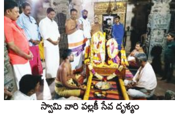
స్వామి వారి పల్లకీ సేవ దృశ్యం