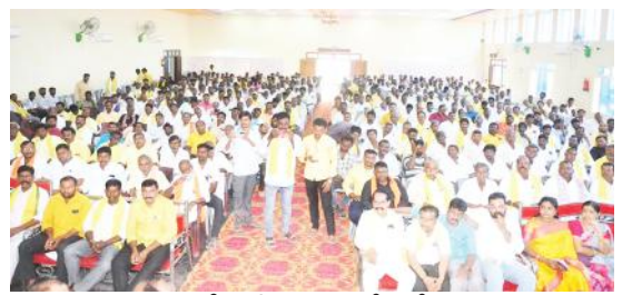
సమావేశానికి హాజరైన తెదేపా శ్రేణులు