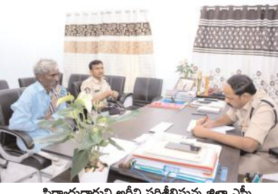
ఫిర్యాదుదారుని అర్జీని పరిశీలిస్తున్న జిల్లా ఎస్పీ