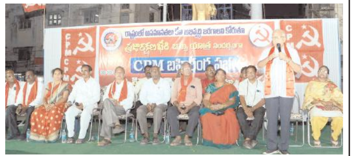
మాట్లాడుతున్న అశోక్ దావల్

కర్నూలు ఎడ్యుకేషన్, మేజర్ న్యూస్: కేంద్రంలోని బిజెపి పాలన అదానీ అంబానీలకు తోడ్పడుతూ మారి పని చేస్తుందని సిపిఎం పాలిట్ బ్యూరో సభ్యులు సిపిఎం పాలిట్ బ్యూరో సభ్యులు అశోక్ దావల్ విమర్శించారు. సాగునీటి ప్రాజెక్టులు, మిగతా 6లో