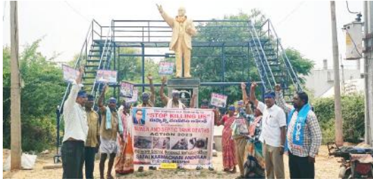
అంబేద్కర్ విగ్రహం ముందు కక్షకు గంతులు కట్టుకొని నిరసన తెలుపుతున్న సఫాయి కర్మచారులు