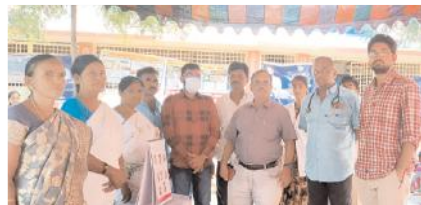
కేంద్రాలను తనిఖీ చేస్తున్న జిల్లా నోడల్ అధికారి