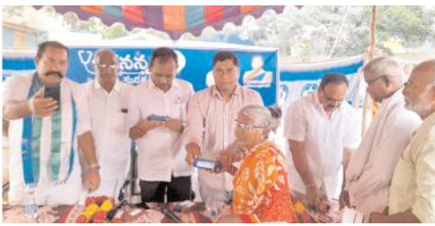
మందులు పంపిణీ చేస్తున్న దృశ్యం