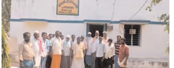
గోనెగండ్ల ఎల్లెల్లీ కార్యాలయం దగ్గర నిరసన తెలుపుతున్న ఆయకట్టు రైతులు

ల్లో పంటలు ఎండిపోతున్నాయని వారు తెలిపారు. ఇప్పటికైన అధికారులు స్పందించి ఆయా టకట్టు పొలాలకు నీరు అందేలా చూడాలని కోరారు. ఈ కార్యక్రమంలో గోనెగండ్ల, కులుమాల, గ్రామలతో పాటు పలు గ్రామాల రైతులు పాల్గొన్నారు.