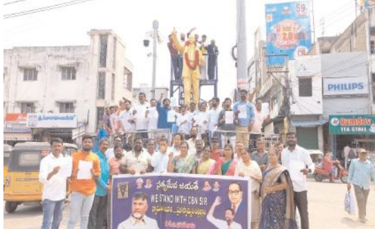
అంబేద్కర్ కు వినతిపత్రం సమర్పిస్తున్న దృశ్యం