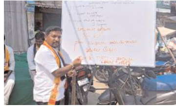
రక్తంతో వ్రాస్తున్న టీడీపీ కార్యకర్త