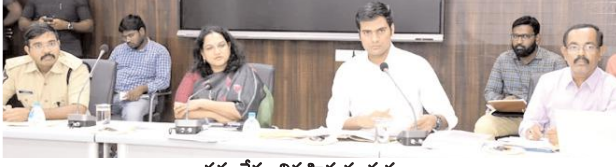
సమావేశం నిర్వహిస్తున్న దృశ్యం

ప్రాముఖ్యతను వివరించారు. బనిన ఉత్సవాలుగా ప్రసిద్ధి గాంచిన శ్రీశ్రీ మాతా సమితి మల్లేశ్వరస్వామి దసరా ఉత్సవాలు ఈ నెల 19 నుంచి 28వ వరకు హోళగుండ మండలం దేవరగట్టులో జరుగుతున్నాయని, 80వేల నుంచి లక్షల వరకు మిగతా 2లో