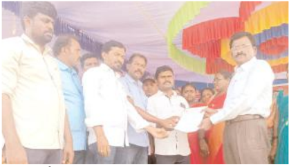
డీఆర్వోకు వినతిపత్రం అందజేస్తున్న వివోవల