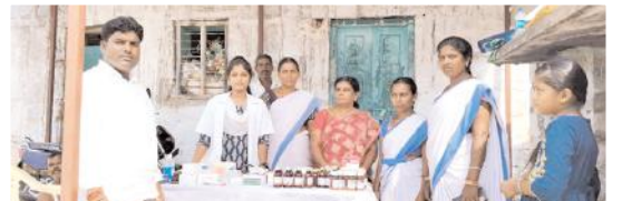
ఉచిత వైద్య శిబిరం ఏర్పాటు చేసిన దృశ్యం