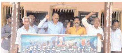
ధర్మా చేస్తున్న వ్యవసాయ కార్యక సంఘం నాయకులు