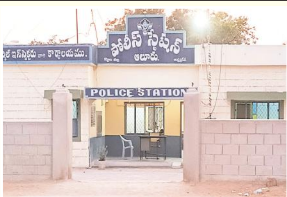
అలూరు పోలీస్ స్టేషన్