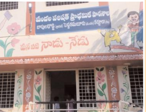
మండల పరిషత్ ప్రాథమిక పాఠశాల దృశ్యం

మే ఉంటున్నట్లు వారు తెలిపారు. పాఠశాల పరిస్థితి ఈ రకంగా ఉన్నా మండలంలో ఇద్దరు మండల విద్యాశాఖ అధికారులు ఉన్నప్పటికీ ఏనాడూ పాఠశాల వైపు కన్నెత్తి కూడా చూడటం లేదని వారన్నారు. విద్యాశాఖ అధికారులు పాఠశాల పై నిర్లక్ష్యంగా కారణంగానే ఉపాధ్యాయులు ఆడింది ఆట.. పొడింది పాటగా వ్యవహరిస్తున్నారని తెలిపారు. ఇప్పటికైనా జిల్లా విద్యాశాఖ అధికారులు స్పందించి బావులదొడ్డి ప్రాథమిక పాఠశాలకు విధులకు దుమ్మా కోడుతున్న ఉపాధ్యాయులు పై చర్యలు తీసుకోవాలని పలువురు వైసీపీ గ్రామ నాయకులు విద్యార్థులు తల్లిదండ్రులు కోరుతున్నారు. ఎంజి రామమూర్తి వివరణ : బావులదొడ్డి పాఠశాలకు తరచుగా విధులకు గైరుహాజరువుతున్న ఉపాధ్యాయుల పై గ్రామ వైసీపీ నాయకులు చేస్తున్న ఆరోపణలు పై మండల విద్యాశాఖ అధికారులను మేజర్ న్యూస్ విలేఖరి వివరణ కోరగా అందుకు వారు స్పందిస్తూ.. ప్రస్తుతం ముగ్గురు ఉపాధ్యాయులు సక్రమంగా పాఠశాలకు వస్తున్నారని ఆయన వివరణ ఇచ్చారు.