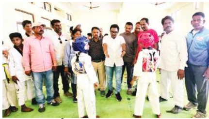
పోటీలను ప్రారంభిస్తున్న దృశ్యం