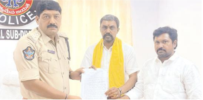
డిఎస్సీకి ఫిర్యాదు చేస్తున్న టీడీపీ నాయకులు