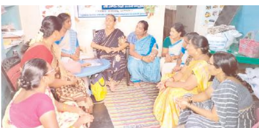
సమావేశంలో సమస్యలపై చర్చించుకుంటున్న అసోసియేషన్ నాయకురాలు