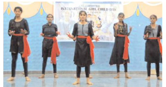
సమాజంలో బాలికల పరిస్థితులపై అభినయంతో వివరిస్తున్న విద్యార్థినులు