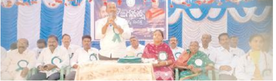
సమావేశంలో మాట్లాడుతున్న ఎంపిపి

చూసిచూడనట్లు వ్యవహరించాల్సిందే. అయితే ఎన్నెన్నో విధాలు నిర్వహించే వారు పాలక పక్షానికి సహోర్ధ్వ చేయాలన్నా ప్రతిపక్షంలో జిల్లాలో పెద్ద కుటుంబం ఉండడంతో అంత సాహసం చేయలేకపోతున్నారు. ఇటు పాలక పక్షానికి అటు ప్రతిపక్ష నాయకులు మద్య నలగడం ఎందుకని ఆలూరుకు దూరంగా వెళ్తున్నారు. ఆలూరు సర్కిల్ పరిధిలోకి దేవనకొండ.. పత్తికొండ రూరల్ సర్కిల్ పరిధిలో ఉన్న దేవనకొండ పోలీస్ స్టేషన్‌ను