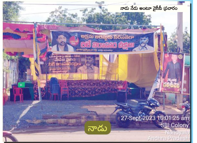
నాడు నేడు అంటూ వైసీపీ ప్రచారం

27-Sept-2023 10:01:25 am SBI Colony Nandyala Andhra Pradesh