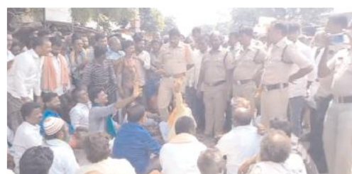
రోడ్డుపై కూర్చోని ధర్నా చేస్తున్న గ్రామ రైతులు, నాయకులతో మాట్లాడుతున్న పోలీసులు