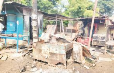
దగ్ధమైన దుకాణాల దృశ్యం