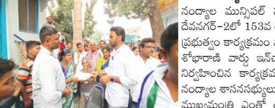
ప్రజలతో మాట్లాడుతున్న ఎమ్మెల్యే శిల్పారవి అభివృద్ధి కోసం ప్రవేశపెట్టిన గడపగడపకు మన ప్రభుత్వం కార్యక్రమం ప్రజాదరణ పొందుతున్నదని తెలిపారు. రాష్ట్ర ప్రభుత్వం అందిస్తున్న సక్షేప ఫలాలు ఏయే స్థాయిలో ఎవరికి చెందుతున్నాయో ఎమ్మెల్యే ఆరాతీసి ప్రజలను అడిగి తెలుసుకున్నారు. ఈ సందర్భంగా ఎమ్మెల్యే మాట్లాడుతూ రాష్ట్ర ముఖ్యమంత్రి జగన్మోహన్ రెడ్డి సంక్షేమ పథకాలైన నవరత్నాలు తదితర అంశాలు ప్రజాదరణ పొందుతూ ప్రజల్లో జగన్మోహన్ నెరవేరు నమ్మకం కుదిరించుకుంటూ అభివృద్ధి దృష్టిలో పయనిస్తున్నారన్నారు. రాష్ట్ర ప్రభుత్వం పాఠశాల అభివృద్ధి కోసం నాడునేడు కార్యక్రమం అనేక రకాలైన హామీలను నెరవేరుస్తున్న ఏకైక ముఖ్యమంత్రి జగన్మోహన్ రెడ్డి అని కొనియాడారు. తెలుగుదేశం పార్టీ అభివృద్ధిని గాలికి పది లేసిందని వైయస్ఆర్ ప్రభుత్వం అధికారంలోకి వచ్చిన తరువాత నంద్యాల అభివృద్ధి జరుగుతుందన్నారు. ఈ కార్యక్రమంలో చైరమర్ల మామన్నసా, వైస్ చైర్మన్ పాంపాపతి, పట్టణ అధ్యక్షులు పడకండ్ల సుబ్రహ్మణ్యం, పున్నా శేషయ్య, జాకీర్ హుసేన్, రమణ, తదితరులు పాల్గొన్నారు.