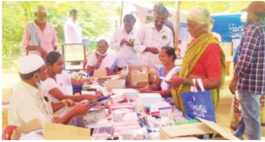
వైద్య పరీక్షలు నిర్వహిస్తున్న వైద్యులు