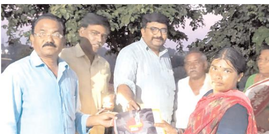
మిని మ్యూనిసిపల్ కమిటీ ప్రజలకు వివరిస్తున్న టిడిపి నాయకులు