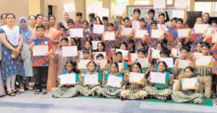
విద్యార్థులకు సర్టిఫికేట్లు అందజేసిన దృశ్యం