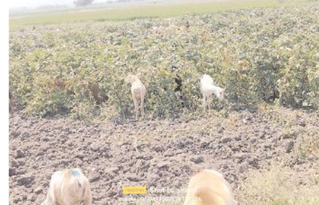
పశువులు, గొర్రెలు మేతగా పత్తిపంట

అనుకుంటే పరుణ కరుణ కోసం ఎదురు చూపులు తప్పడం లేదు. దిగువ కాలువకు సైతం అక్రమ ఆయకట్టుతో చేరాల్సిన నీరు దిగువకు రాక మరింత ఇబ్బంది కలుగుతుంది. ఇటు సాగు నీరు అందక, అటు వర్షాలు లేక పెట్టిన పెట్టుబడులు రాక కరువు నేలపై కర్షకుని వ్యధ వర్ణనాతీతంగా ఉంది.