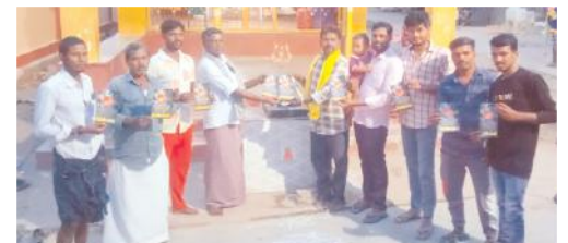
కరపత్రాలను పంపిణీ చేస్తున్న దృశ్యం