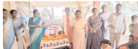
పౌష్టికాహారం గురించి వివరిస్తున్న అధికారులు