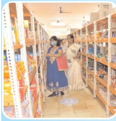
కొనుగోలు చేస్తున్న మహిళలు

కర్నూలు, మేజర్ న్యూస్ ప్రతినిధి: స్వయం సహాయక సంఘాల మహిళల ఆర్థిక సాధికారత దిశగా ప్రభుత్వం చేస్తున్న అడుగులు సత్ఫలితాలుస్తున్నాయి. మహిళలను వ్యాపారవేత్తలుగా తీర్చిదిద్దేందుకు ప్రారంభించిన జగనన్న మహిళా మార్ట్ లు విజయవంతంగా నడుస్తున్నాయి. మహిళ పేర్ హోల్డర్ గా వారి ఆధ్వర్యంలోనే