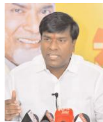
ఎమ్మిగనూరు టౌన్, మేజర్ న్యూస్ : మాజీ సీఎం చంద్రబాబు

నాయుడు అక్రమ అరెస్టుకు నిరసిస్తూ గత 33 రోజులుగా వివిధ కార్యక్రమాలతోపాటు రిలే నిరాహార దీక్షలు చేపట్టి సంఘీభావం తెలిపిన ఎమ్మిగనూరు నియోజకవర్గం టీడీపీ నాయకులకు, కార్యకర్తలకు, అభిమానులకు, ప్రజలకు మాజీ ఎమ్మెల్యే బీబీ. జయనాగేశ్వర్ రెడ్డి ధన్యవాదాలు తెలిపారు. ఈ సందర్భంగా ఆయన మాట్లాడుతూ ఏ విధమైన అవినీతి జరగని స్వేచ్ఛా దేవలపైనే కేసులో చంద్రబాబుపై ప్రభుత్వం అక్రమ కేసులు బాణాయించడం అమానుషమని ఆయన పేర్కొన్నారు. 14 ఏళ్ల ముఖ్యమంత్రిగా చేసిన చంద్రబాబు నీతి, నిజాయితీకి మారు పేరు అన్నారు. ప్రపంచవ్యాప్తంగా చంద్రబాబు అక్రమ అరెస్టుకు అనేక మంది ఐటీ ఉద్యోగులు నిరసనలు తెలిపారన్నారు. వైసీపీ ప్రభుత్వం ఎన్నికకాలు ఇబ్బందులు పెట్టిన తెలుగుదేశం పార్టీ విజయం అడ్డుకోలే రన్నారు. ప్రజలంతా చంద్రబాబు పక్షాన నిలబడి పోరాటం చేస్తారన్నారు. న్యాయ వ్యవస్థ పై గౌరవం ఉందని, చంద్రబాబుకి ఖచ్చితంగా న్యాయం జరుగుతుందని, కడిగిన ఆణిముత్యంలో బయటకు వస్తారన్నారు. రాష్ట్ర భవిష్యత్ కోసం చంద్రబాబు మళ్ళీ సీఎం అవుతారన్నారు. వచ్చే ఎన్నికల్లో వైసీపీకి ప్రజలు తగిన గుణపాఠం చెబుతారని హెచ్చరించారు. అలాగే భవిష్యత్ కు గ్యారంటీ కార్యక్రమాన్ని ప్రతి ఒక్క నాయకులు, కార్యకర్తలు ఇంటింటి వెళ్లి ప్రచారాన్ని నిర్వహించాలన్నారు.