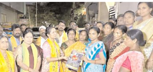
కల్లూరు, మేజర్ న్యూస్ : తెలుగుదేశం పార్టీ అధికారంలోకి వస్తే రాష్ట్ర అభివృద్ధిలో పాటు మహిళా సాధికారత లభిస్తుందని టిడిపి పాఠ్యం