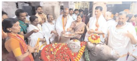
నందిశ్వరునికి ప్రదోషకాల పూజలను నిర్వహిస్తున్న దృశ్యం

(మొదటిపేజీ తరువాయి) ఆవిష్కరించారు. అలాగే ఆలయంలో సూతనంగా ప్రవేశ పెట్టిన నందిశ్వరాభిషేకం, నందిశ్వర పీఠార్చన, ప్రదోష పూజలను ప్రారంభించారు. నందిశ్వరునికి విశేష అభిషేకాలు నిర్వహించారు. అనంతరం వారు మాట్లాడుతూ దేవీ శరన్నవరాత్రి మహోత్సవాలు అత్యంత వైభవంగా నిర్వహిస్తున్నామని తెలిపారు. భక్తులు వేలాదిగా తరలి వచ్చి స్వామి, అమ్మవార్లను దర్శించుకోవాలన్నారు. ప్రతి నిత్యం అమ్మవారికి వాహన సేవలను నిర్వహిస్తున్నామన్నారు. చండీ,