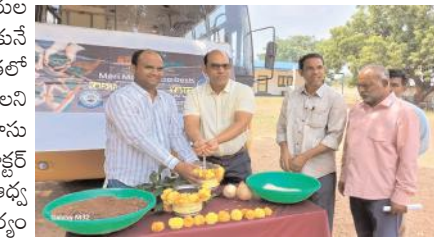
మట్టి, బియ్యం సేకరిస్తున్న దృశ్యం