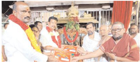
పత్రికలను ఆవిష్కరిస్తున్న అధికారులు

(మొదటిపేజీ తరువాయి) ఆవిష్కరించారు. అలాగే ఆలయంలో సూతనంగా ప్రవేశ పెట్టిన నందిశ్వరాభిషేకం, నందిశ్వర పీఠార్చన, ప్రదోష పూజలను ప్రారంభించారు. నందిశ్వరునికి విశేష అభిషేకాలు నిర్వహించారు. అనంతరం వారు మాట్లాడుతూ దేవీ శరన్నవరాత్రి మహోత్సవాలు అత్యంత వైభవంగా నిర్వహిస్తున్నామని తెలిపారు. భక్తులు వేలాదిగా తరలి వచ్చి స్వామి, అమ్మవార్లను దర్శించుకోవాలన్నారు. ప్రతి నిత్యం అమ్మవారికి వాహన సేవలను నిర్వహిస్తున్నామన్నారు. చండీ,