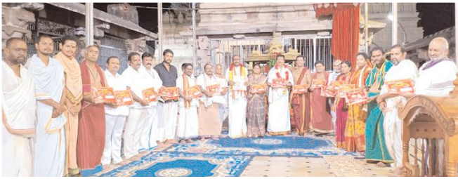
మహానంది క్షేత్రంలో దసరా ఆహ్వానం