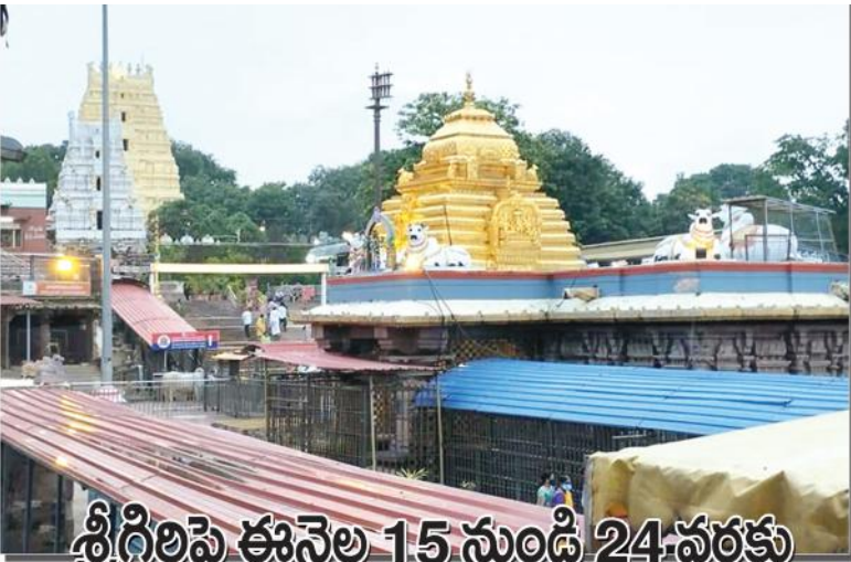
శ్రీధిలిపై ఈనెల 15 నుండి 24వరకు