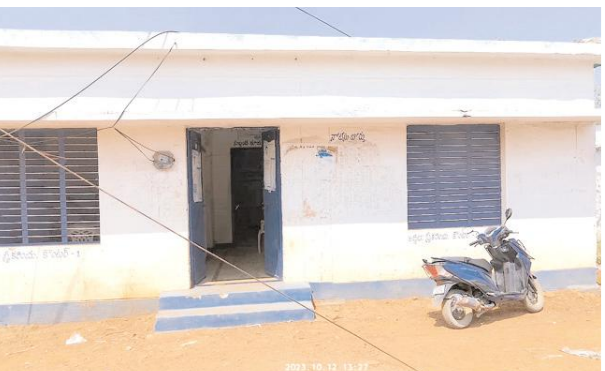
పేరు లేని బూరుగుల గ్రామ సచివాలయం

ప్యాపిలి, మేజర్ న్యూస్ : ప్రజలు, రైతులు సుదూర ప్రాంతంలో ఉన్న మండల కేంద్రాలకు వెళ్ళి వారి పనులు చేయించుకోవడానికి అనేక ఇబ్బందులు పడుతున్నారన్న ముఖ్య ఉద్దేశ్యంతో రాష్ట్ర ముఖ్యమంత్రి వైయస్.జగన్ మోహన్ రెడ్డి గ్రామ, వార్డు సచివాలయాలను ఎంతో ప్రతిష్టాత్మకంగా ఏర్పాటు చేశారన్న సంగతి ప్రతి ఒక్కరికీ తెలిసిన విషయమే. ఈ గ్రామ, వార్డు సచివాలయాలను ఏర్పాటు చేసి ప్రజలు, రైతులు మిగతా 2లో