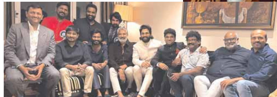
శ్రమపడ్డారు. డ్యాన్స్ ని సింక్ కోసమే రాబ్బరణ్, ఎన్టీఆర్ 18 టేక్కు

విశ్వ సంచలనంగా వేదికనెక్కిన నాటు నాటు పాట ఆస్కార్ వేదికపై అందరినీ మంత్రముగ్ధం చేస్తూ స్వైచ్చులు వేయించి, హుషారెత్తించింది. స్వాతంత్ర్య పోరాట విప్లవ కారులు అల్లూరి సీతారామరాజు, కొమరం భీమ్ మధ్య స్నేహానుభంధాన్ని తెలియజేస్తూ వచ్చిన ఈ పాటను భారతీయ సినిమా నుంచి తొలిసారి ఆస్కార్ కు నామినేట్ అయిన గీతమిది అంటూ పాట గురించి దీపికా పడుకోన్ అక్కడి ఆహుతులకు వివరించింది. అనంతరం గాయకులు కాలఖైరవ, రాహుల్ సిప్లిగంజ్ లైవ్ లో ఈ పాటను ఆలపించారు. ప్రముఖ