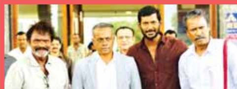
విశాల్ సినిమాలో డైరెక్టర్లు ... 9వ పేజీలో