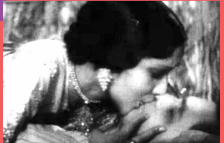
అప్పట్లో లిప్ లాక్ (అలనాటిసిత్రాలు) ... 6వ పేజీలో