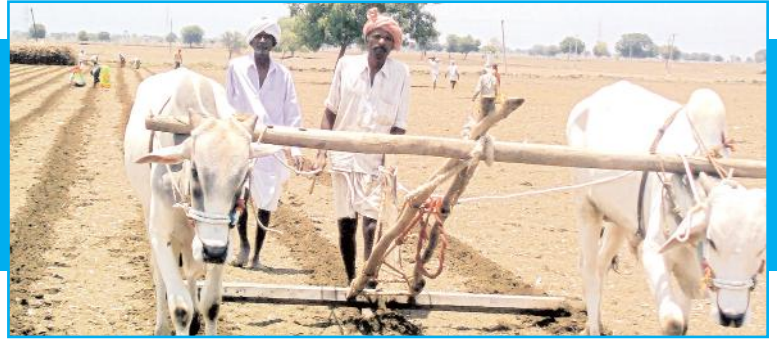
టిడిపి, జనసేన మేనిఫెస్టోకు..