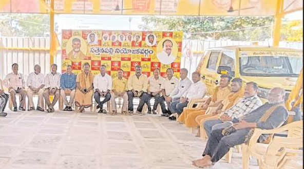
జరిగిందన్నారు. దాదాపుగా 26 వేల మంది బీసీలపై తప్పుడు కేసులు పెట్టి వందల మంది బీసీలను హత్యలు చేసి, బీసీ కార్పొరేషన్లను నిర్మూలన చేసి, బీసీ నిధులను దారి మళ్లించి... 56 కులాలకు కార్పొరేషన్లు అని పెట్టి ఏ ఒక్క కార్పొ

సత్యనాథ ప్రతినిధి, మేజర్ న్యూస్: బీసీలను మోసం చేసిన వైసీపీకి సాధికార సమితి యాత్ర చేసే అర్హత ఎక్కడిదని సత్యనాథ నియోజకవర్గ బీసీ నాయకులు ప్రశ్నించారు. శుక్రవారం నియోజక వర్గంలోని బీసీ నాయకులు ఏర్పాటు చేసిన సమావేశంలో మాట్లాడారు. సామాజిక సాధికార బస్సు యాత్ర పేరుతో బీసీలను వంచించటానికి వస్తున్న వైసీపీ నాయకులు, బీసీలపై జరిగిన దాడులకు, హత్య కేసులకు సమాధానం చెప్పాలని తెలుగుదేశం పార్టీ నాయకులు డిమాండ్ చేశారు. గతంలో తెలుగుదేశం పార్టీ ఇచ్చిన 34% రిజర్వేషన్లు 24% కు తగ్గించిన వైసీపీ ప్రభుత్వం, 16,800 మంది బీసీ నాయకులను ప్రజా ప్రతినిధులుగా కాకుండా అడ్డుకో వడం