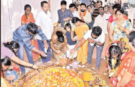
భక్తులకి తీర్థప్రసాదాలు అందజేశారు.