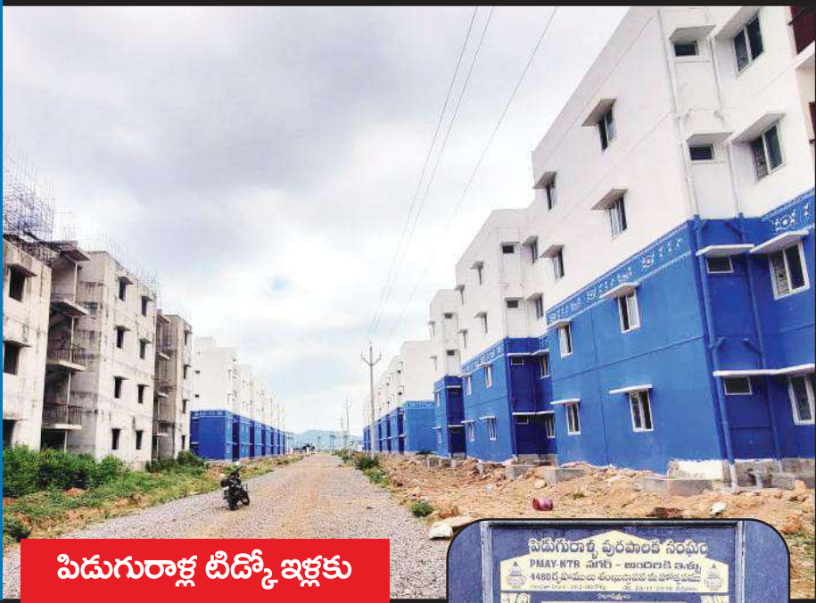
పిడుగురాళ్ల టీడీపీ ఇళ్లకు