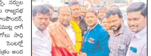
న్నారని. ఆడిగితే ఉద్యోగం నుండి తొలిగిస్తున్నారని ఆ పత్రంలో పేర్కొన్నారు. క కనీస భద్రత కల్పించాలని వారు కోరారు. ఆసుపత్రులలో కాంపౌండర్, నర్సులుగా కొనసాగే వారందరూ బిసి, ఎస్సీ, ఎస్టీ, ముస్లిం, మైనారిటీ