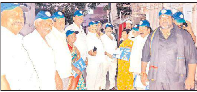
రెడ్డి సారధ్యంలో రాష్ట్రంలో సంక్షేమ ముఖ్యమంత్రిగా జగన్మోహన్ రెడ్డి పాలన సాగుతుందని, రాష్ట్రానికి మరలా కావాలని ప్రజలు కోరుకుంటున్నారని,