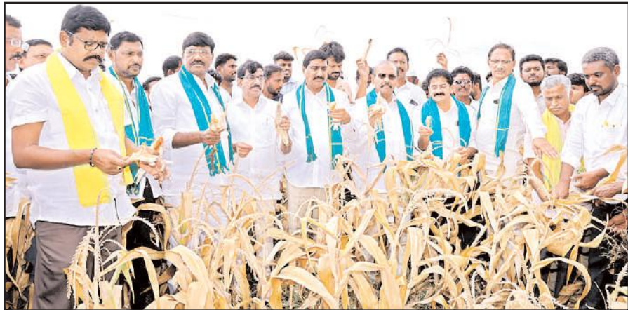
చిలకలూరిపేట, మేజర్ న్యూస్:

వైకాపా ప్రభుత్వం మొక్కుబడిగా కరవు ప్రకటన చేసింది.. నష్టపోయిన రైతులకు తక్షణసాయమేదని మాజీమంత్రి, తెదేపా రాష్ట్ర ఉపాధ్యక్షుడు ప్రతిపాటి పుల్లారావు ప్రశ్నించారు. కరవు మండలాల్ని గుర్తిస్తూ ఉత్తర్వులు జారీ చేసిన ప్రభుత్వం, ఉపశమన చర్యల్లో మాత్రం ఎందుకు మీనమేషాలు లెక్కిస్తోందని ఆయన మండిపడ్డారు. చిలకలూరిపేటలోని క్యాంపు కార్యాలయంలో ఆదివారం ప్రతిపాటి మీడియాతో మాట్లాడారు.