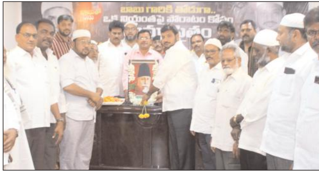
గుంటూరు, మేజర్ న్యూస్ : జాతీయ విద్యా దినోత్సవం, మౌలానా అబుల్ కలాం ఆజాద్ జయంతి సందర్భంగా సందర్భంగా గుంటూరు తూర్పు