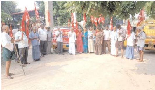
చేయాలని పిలుపునిచ్చారు. ఈ సభకు సిపిఎం ఆల్ ఇండియా కార్యదర్శి సీతారాం ఏచారి, పోలేట్