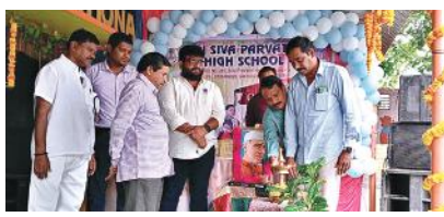
శ్రీ శివ పార్వతి పాఠశాలలో పుల్లంపేట మేజర్ న్యూస్: పుల్లంపేట మండల కేంద్రంలోని శ్రీ శివ పార్వతి విద్యాసంస్థలలో బాలల దినోత్సవ వేడుకలు పాఠశాల యాజమాన్యం ఘనంగా నిర్వహించింది.