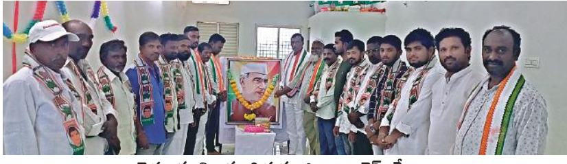
నెహ్రూకు నివాళులర్పిస్తున్న జిల్లా కాంగ్రెస్ శ్రేణులు

అందించి 4 సార్లు ప్రధానమంత్రిగా దేశానికి జన రంజక పాలన అందించిన నెహ్రూ పేరు సువర్ణ ఆక్షరాలతో భారతదేశ చరిత్ర పుటల్లో నిలిచిపోయిందన్నారు స్వర్ణీయ ప్రధాని నెహ్రూ జయంతి సందర్భంగా తమ కాంగ్రెస్ పార్టీ జిల్లా కార్యాలయంలో నెహ్రూ చిత్రపటానికి పూలమాల వేసి, కేక్ కట్ చేసి కాంగ్రెస్ శ్రేణులతో కలిసి ఆయన ఘనంగా నివాళులర్పించారు. ఈ సందర్భంగా ఆయన మాట్లాడుతూ ప్రజల సౌకర్యార్థం దేశంలో ఎన్నో వంతెనలు, రోడ్లు మార్గాలు,