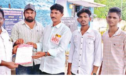
ఆర్డీసీ డిఎంకు వినతిపత్రం ఇస్తున్న డివైఎఫ్ఐ నాయకుల

వివిధ కారణాలతో నడిరోడ్డు మీద ఆగిపోయింది అన్నారు. రాత్రి 10 గంటల సమయంలో ఆగిపోతే అర్ధరాత్రి 2.30 నిమిషాల వరకు పట్టించుకునే వారే లేరు అన్నారు. అసంతరం ఆర్డీసీ అధికారులు ఇతర బస్సులో ప్రయాణికులను పంపించారు అన్నారు. మొన్న విజయవాడలో సంఘటన మరువక ముందే ఇప్పుడు బస్సు ఇతర కారణాల రీత్యా ఆగిపోవడం ప్రయాణికులను భయభ్రాంతులకు గురిచేసింది సంఘటన అన్నారు. ముందుగా బస్సు సర్వీసులు బయలుదేరే ముందు కండిషన్ వుందా, లేదా అని చూసుకోకుండా పంపిస్తే ఇలానే జరుగుతాయి అన్నారు. ఏదైనా జరిగి వుంటే భాద్యత ఎవరు వహిస్తారు అన్నారు. ప్రస్తుతం ఆర్డీసీ అధికారులు హైయర్ బస్సుల మీద