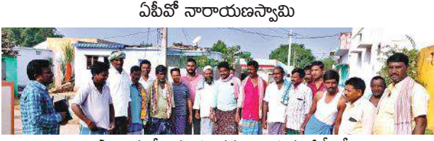
ఉపాధి కూలీలకు సూచనలు ఇస్తున్న ఏపీఎస్

ములకలచెరువు , మేజర్ న్యూస్ : ములకలచెరువు మండలంలోని సోంపల్లి గ్రామంలో శుక్రవారం ఏపీఎస్ నారాయణస్వామి ఎస్సీ కాలనీలో ఉపాధి హామీ కూలీలతో సమావేశం నిర్వహించారు. ఈ సందర్భంగా ఆయన మాట్లాడుతూ ప్రభుత్వం ఉపాధిహామీ పథకం ద్వారా జాబ్ కార్డ్ కలిగిన ప్రతి కుటుంబానికీ 100 రోజుల పని కల్పిస్తుంది. దీని ద్వారా సంవత్సరానికి 27200/- రూపాయలు ఉపాధి పొందే అవకాశం ఉంది, అయితే కూలీల చేసే పని పరిమాణంబట్టివేతనం లభిస్తుంది అని అన్నారు. మరి ముఖ్యంగా గ్రామాలలో ఎస్సీ, ఎస్టీ కుటుంబాలవారు ఉపాధి హామీ పథకాన్ని మరింత సమర్థవంతంగా ఉపయోగించుకోవాలని వీరి జీవనోపాధి పెంపొందించుకోవాలని ఎపిఓ నారాయణస్వామి తెలిపారు. ఫీల్డ్ అసిస్టెంట్ శివశంకర్ ఉపాధి కూలీలు పాల్గొన్నారు.