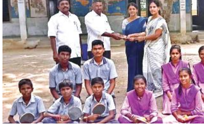
విద్యార్థులకు ఆర్థిక సాయం అందిస్తున్న కమిటీ చైర్మన్

- విద్యార్థులకు అభివృద్ధి కమిటీ చైర్మన్ చేయూత