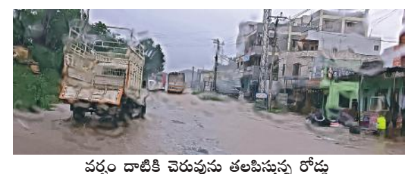
వర్షం దాటికి చెరువును తలపిస్తున్న రోడ్డు