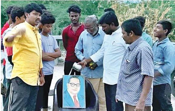
అంబేద్కర్ చిత్రపటానికి పాలాభిషేకం చేస్తున్న దృశ్యం

బిజెపి ఎస్సీ మోర్చా నాయకులు మేకల ఆంజనేయులు