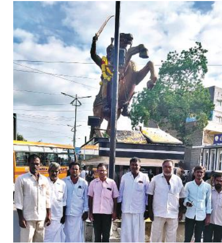
నరసింహారెడ్డి విగ్రహానికి పూలమాలవేసి నివాళులర్పిస్తున్న దృశ్యం