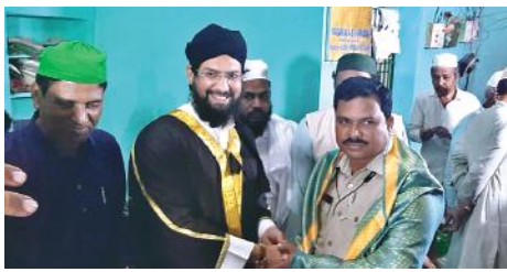
హజరత్ అలీ మురాద్ సాహెబ్ దర్గా గంధం ఉత్సవాలకు హాజరైన తాలుక సీబి ఎస్ ఐ కు దర్గా ముతపల్లి హజరత్ తాహిర్లూ ఖాదిరి వాళ్లను శాల్యాళ్లతో ఘనంగా సన్మానించడం జరిగింది