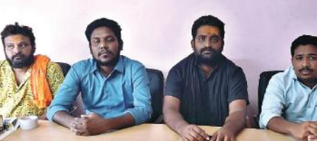
సమావేశంలో మాట్లాడుతున్న వైకాపా నాయకులు

పోతుందని వారన్నారు. అభివృద్ధి విషయంలో పులివెందులలో జరుగుతున్న అభివృద్ధి పనులు నీకు కనిపించలేదని వారు ప్రశ్నించారు. మెడికల్ కాలేజీ, శిల్పా రామం, ఆర్టికల్బర్ అగ్రికల్చర్ కళాశాలలు, స్వామి నారాయణ విద్యాపీఠం, ఆదిత్య బిల్డర్ రింగ్ రోడ్ లో మినిస్ట్రీ కేటేరియల్ ఇండ్రీ మ్యూజియం తోపు ఇలా చెప్పుకుంటూ పోతే పులివెందుల లో జరిగిన అభివృద్ధి పనులు చూసేందుకే ఒకరోజు పైన పడు తుందన్నారు. తెలుగుదేశం పార్టీ ఉనికి కాపాడుకునేందుకే టీడీపీ నాయకులు వైకాపావారిపై లేనిపోని ఆరోపణలు చేస్తున్నారన్నారు. జరగబోయే ఎన్నికలలో తెలుగుదేశం పార్టీకి నియోజక వర్గ ప్రజలు ప్రజలే