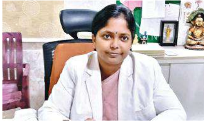
సెమెన్ అనాలసిస్ పరీక్షలు ఉచితంగా నిర్వహిస్తామన్నారు. శిబిరానికి రాదలచినవారు 799562 9110 అనే సెల్ నెంబర్ నంబర్ ప్రదించాలని డాక్టర్ కోరారు