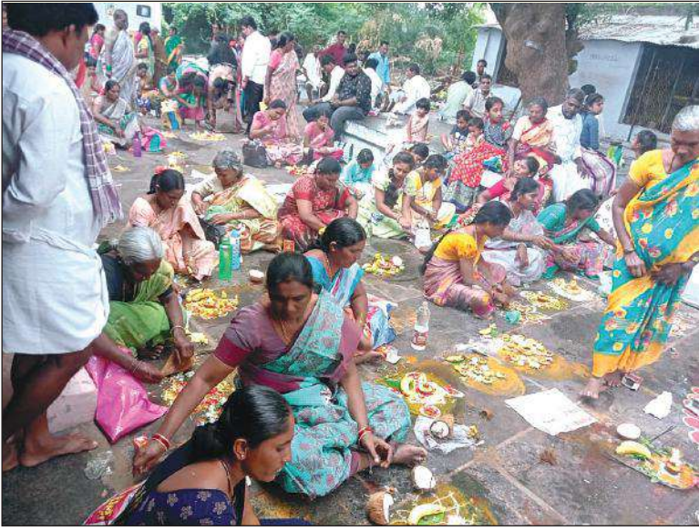
కార్తీక పౌర్ణమి సందర్భంగా జమ్మలమడుగు శివాలయంలో పూజలు నిర్వహిస్తున్న భక్తులు