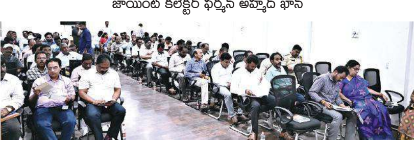
జాయింట్ కలెక్టర్ ఫర్వన్ అహ్మద్ ఖాన్