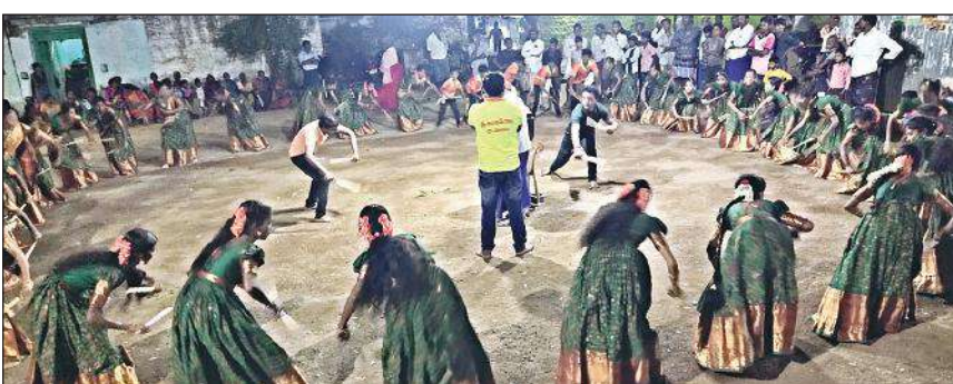
సింగన పల్లెలో కోలాటం వేస్తున్న మహిళలు

చేశారు. పెద్ద ఎత్తున మహిళలు ఆలయ ప్రాం గణంలో దీపాలను వెలిగించి, పూజలుచేసేతమ మ్రొక్కులను తీర్చుకు న్నారు. అలాగే మండల లంలోని పుల్లారెడ్డిపేట, కాసుగుడూరు, ఇడమడక, గోపులా పురం క్రాస్ రోడ్డు వద్ద గల శివాలయాల నందు గుడిపాడు, చింతకుంట, గొల్లపల్లె పెద్ద సింగన పల్లె, నీలాపురంలోని కొండ్రాయ ఈశ్వర స్వామి సన్నిధి నందు నల్లమల్ల అడవుల్లో వెలసి ఉన్న మల్లె గుండం నందు వెలసిన శివాలయాలకు భక్తులు వెళ్లి శివ పార్వతులను దర్శించుకొని కార్తీక దీపాలను వెలిగించారు. అలాగే అన్నదానకార్యక్రమాలు ఏర్పాటు చేశారు . రాత్రికి హరిభజనలు నిర్వహించారు. కార్తీక ప్రాథమి పురస్కరించుకుని చిన్నసింగన పల్లె గ్రామంలో కోలా టంనిర్వహించారు. ఈకోలాటంచూసేందుకు చుట్టు ప క్కుల గ్రామాల నుంచి పెద్దఎత్తున ప్రజలు హాజరయ్యారు. వచ్చిన భక్తులందరికీ రాత్రికి ప్రసాదం పంపిణీ చేశారు.