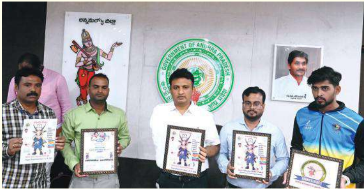
ద్వారా నమోదు చేసుకోవచ్చునని చెప్పారు. సచివాలయ స్థాయి నుంచి రాష్ట్ర స్థాయి వరకు క్రీడల నిర్వహణ ఉంటుందని ఇందు లో పురుషులు, మహిళలకు విడివిడిగా క్రీడలు నిర్వహిస్తారని తెలిపారు. డిసెంబర్ 15 నుంచి 2024 ఫిబ్రవరి