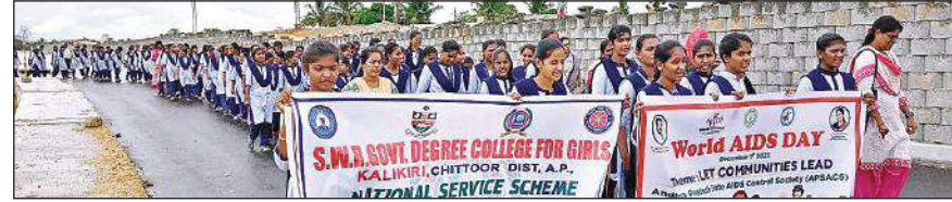
ఎయిడ్స్ వ్యాధిపై విద్యార్థినులకు అవగాహన కల్పిస్తున్న ప్రిన్సిపల్, ఆర్ఆర్ఎస్ సిబ్బంది