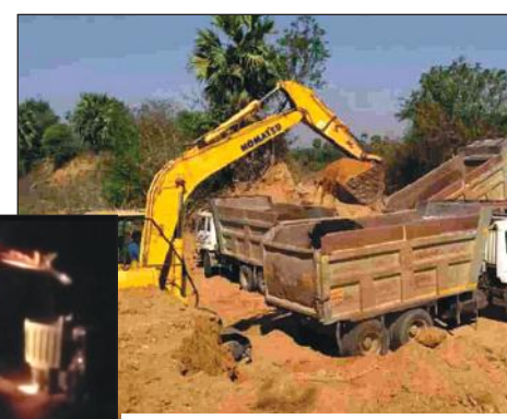
అర్ధరాత్రి గడికోటలోని మాండవ్య నదిలో టిప్పర్లకు ఇసుక నింపుతున్న హిటాచి

అన్నమయ్య బ్యారో, మేజర్ స్టాన్: అన్నమయ్య జిల్లా రాజంపేట నియోజకవర్గంలోని వీరబల్లి మండలంలో వీరబల్లి బెనిష మామిడికాయలు ఎంత ఫేమస్ అదేవిధంగా మండలంలోని ఇసుక కూడా అందరికీ అంతా పేరుపొందినది అన్నమాట కాబట్టి ఈ ఇసుక పై చాలా ఉంది నాయకులు కన్నేసి ఇసుకనే అక్రమ దండాగా పెట్టుకున్నారు. ఇసుక మండలంలో గత 12 రోజుల నుంచి రాయచోటికి హిటాచిల సహకారం తో టిప్పర్లకు ఎత్తుకొని తరలిస్తున్నారని మండల ప్రజలు వాపోతున్నారు. ఆసలే వర్షాలు పడక భూగర్భ జలాలు అడుగంటిపోయి తమకు సాగుకే కాకుండా తాగడానికి కూడా నీరు లేకుండా పోతాయేమో అన్న సందిగ్ధంలో మాండవ్య నది పరివాహ ప్రాంతంలోని రైతులు ప్రజలు పోతున్నారు. మండలంలో ఇంటి అవసరాలకు ఏదైనా ఒక