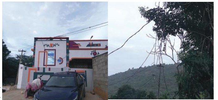
చేసారని తుమ్మ కొండ గ్రామ ప్రజలు ప్రభుత్వానికి విజ్ఞప్తి చేస్తున్నారూ సంబంధిత అధికారిని వివరణ అడగగా తమ వైర్లు తీసిన తరువాత దాని కింద బిల్డింగ్ కట్టారని తెలియజేశారు ఏది ఏమైనప్పటికీ ప్రమాదం అంచులో ఆ ఇల్లు ఉండడం వాస్తవం దీనిపైనే చర్యలు తీసుకోవాల్సిందిగా ప్రజలు కోరుతున్నారు.

బిట్టేలి మేజర్ స్కూల్: అన్నమయ్య జిల్లా చిట్టేలి మండలం తుమ్మ కొండ హరిజనవాడలో విద్యుత్ అధికారుల నిర్లక్ష్యం ప్రజల ప్రాణాలతో చలాగులమాడుతున్నట్లు ఉంది విద్యుత్ వైర్ల వల్ల తమ గ్రామంలో ప్రమాదం ఉందని అనేకసార్లు అధికారులు దృష్టికి తీసుకుపోయినప్పటికీ కాలయాపన చేస్తున్నారే తప్ప చర్యలు తీసుకోవడం లేదని వారు తీవ్ర ఆందోళన వ్యక్తం చేస్తున్నారు తమ మిద్దలపైనే వైరు వెళుతూ ఉంటే వర్షాకాలంలో ఆ ఇంటిలో ఉండాలన్న భయాందోళన ఉందని చెప్పి మద్దలో వైర్లు వేలాడుతున్న పట్టించుకునే వారే లేరని ఎన్నోసార్లు అధికారుల దృష్టికి తీసుకువెళ్లిన స్పందించడం లేదు వర్షాకాలంలో ఏ నిమిషం ఏ క్షణం ఏమి జరుగుతుందో విద్యుత్ వైర్ల తో ప్రజలు ప్రాణాలతో బిక్కు బిక్కుమంటూ జీవనం సాగిస్తున్నారు. ఇప్పటికైనా సంబంధిత అధికారులు స్పందించి తక్షణమే తమ సమస్య పరిష్కారం కోసం కృషి