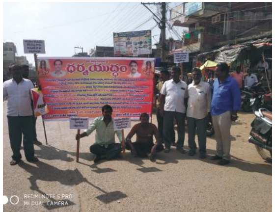
జరగకూడదని ఆయన ముక్తకంఠంగా తెలిపాడు.