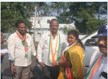
సత్తుపల్లి సూర్య మేజర్ సూర్య