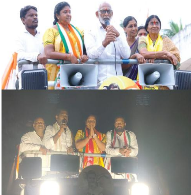
పార్టీ నాయకులు, కార్యకర్తలు తదితరులు పాల్గొన్నారు.