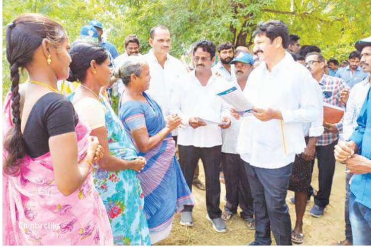
ప్రాధాన్యత క్రమంలో వాటిన్నిటిని పరిష్కరిస్తాం రాష్ట్ర గృహ నిర్మాణ శాఖ మంత్రి జోగి రమేష్

పెడన,మేజర్ స్టాన్ : సమస్యలను తెలుసుకునేందుకే ప్రజల ఇంటి గడప వద్దకు వచ్చానని, త్వరలో ప్రాధాన్యత క్రమంలో వాటిన్నిటిని పరిష్కరించనున్నట్లు రాష్ట్ర గృహ నిర్మాణ శాఖ మంత్రి జోగి రమేష్ పేర్కొన్నారు. ఈ మేరకు బంటుమిల్లి మండలంలో శుక్రవారం మిగతా 2లో