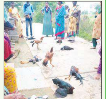
మంది రైతులపైకోళ్లను కక్ష పూరితంగా కొందరు గుర్తు తెలియని వ్యక్తులు కావాలని కోళ్లకు మేతలో గులికలు పెట్టడంతో అవి తిని అక్కడికి కడ్డే కోళ్ల మృతి చెందాయి. కష్టపడి పెంచిన కోళ్లను చంపడంతో అవి చూసి కన్నీరు మున్నేరు పెట్టుకున్న కోళ్ల రైతు. చనిపోయిన కోళ్ల ఖరీదు సుమారు లక్ష రూపాయల దాకా ఉంటాయని కోళ్ల పెంపకం దారుడు ఇలాంటి సంఘటనకు పాల్పడిన వారిపై ఎంక్వైరీ చేసి చట్టపరమైన చర్యలు తీసుకోవాలని ఇలాంటి సంఘటన మరొకసారి జరగకుండా తగు చర్యలు తీసుకోవాలని నష్టపోయిన రైతుకు న్యాయం జరిగేలా చూడాలని ఆవేదన చెందుతున్నారు.

చంద్రపాడు మేజర్ స్టూన్ : చంద్రపాడు మండలం గుడి మెట్ల గ్రామంలో నాటు కోళ్లను పెంచుకుంటున్న కొంత