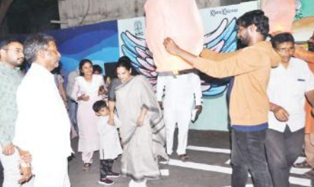
బెలూన్ వదులుతున్న కలెక్టర్