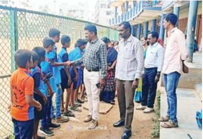
క్రీడాకారులను పరిచయం చేసుకుంటున్న దృశ్యం