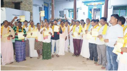
కార్యక్రమంలో పాల్గొన్న టిడిపి నాయకులు