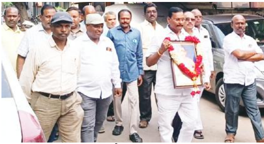
కార్యక్రమంలో పాల్గొన్న ఆర్వవైశ్యులు

రాష్ట్ర అవతరణ దినోత్సవం సందర్భంగా ఆర్వవైశ్యుల ఘన నివాళి