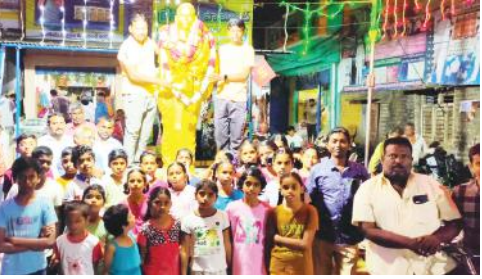
నివాళులర్పిస్తున్న వివేకానంద సంస్థ సభ్యులు