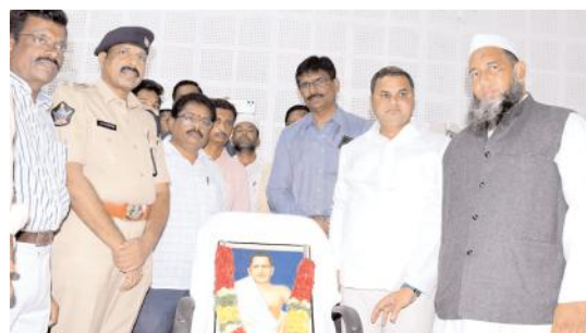
వైఎస్సార్ సెంటిన్ల హోటల్ పొట్టి శ్రీరాములు చిత్రపటానికి పూలమాలలు వేసి నివాళులర్పిస్తున్న ఎస్పీ, పాపిరెడ్డి