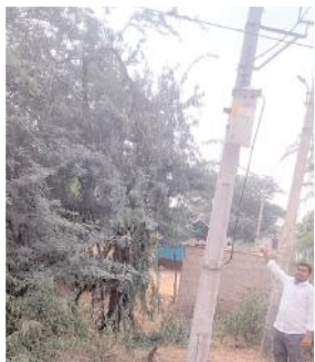
ప్రత్యేక ట్రాన్స్ ఫార్మర్లను ఏర్పాటుచేయించిన సర్పంచ్

- దళిత కాలనీలో ట్రాన్స్ ఫార్మర్లు ఏర్పాటు