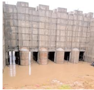
నిర్మాణంలో ఆగిపోయిన ఆర్డీఎస్ రైల్ కెనాల్ తూము

వైఎస్సార్సీపీ అధికారంలోకి వచ్చాక ఏర్పాటైన ఆదోని ఏరియా డెవలప్మెంట్ కమిటీ వలసలకు అడ్డుకట్ట వేయలేకపోయింది. వలసలను నివారించడం, కరవుకు చిరునామాగా మారిన ఈ ప్రాంతంలో ఎలాంటి అభివృద్ధి పనులు చేయాలన్నది గుర్తించేందుకు ఆదోని ఏరియా డెవలప్మెంట్ కమిటీ ఏర్పాటు ముఖ్య ఉద్దేశ్యంగా కనిపిస్తున్నా అదింత వరకు ఆచరణలో కనిపించడం లేదు. ప్రతి ఏటా వలసల నివారణకు ఉపాధి హామీ పనులు పెంచాలంటూ నేతల ప్రకటనలు, పెంచేందుకు తగిన చర్యలు తీసుకునేందుకు ప్రభుత్వ అధికారులతో సమీక్షలకే అంతా సరిపోతోంది. మరి ఈ ప్రాంత ప్రజల జీవన స్థితిగతులు ఎప్పుడు మారతాయో మరి.