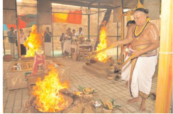
లు నిర్వహించారు. అలాగే వేద మంత్రాల నడుమ హోమం నిర్వహించారు. బుధవారం అర్ధరాత్రి నిర్వహించిన పూర్ణాహుతితో పవిత్రోత్సవాలు దిగువ అహోబిలంలో వైభవంగా ముగిశాయి.