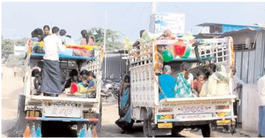
జిల్లా పశ్చిమ ప్రాంతంలో కడివిన వలస బండ్లు (ఫ్రైల్)

పెరిగిపోతోంది. గత ఏడాది ఖరీఫ్లో మిర్చి సాగు