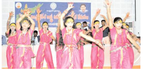
సృష్ట ప్రదర్శనలు చేస్తున్న విద్యార్థులు