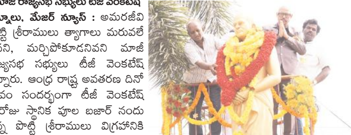
నివాళులర్పిస్తున్న మాజీ రాజ్యసభ్యులు టీజీ వెంకటేశ్