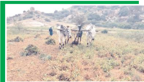
వేరుశనగ పంటను తన కాడెడ్లతో దున్నేస్తున్న రైతు ఎల్లప్పు