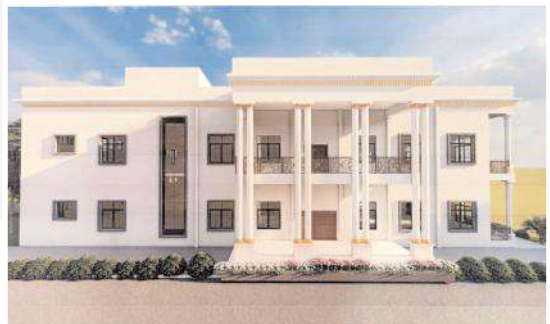
నూతన తిరుమల తిరుపతి దేవస్థానం కల్యాణ మండప సమాన చిత్రం

అని వారు ప్రశ్నించారు. ఆదోని మండలం పెద్దహరివాణం పాఠశాలలో కన్నడ బాషను కొనసాగుతుంటే హోళగుండ ఉన్నత పాఠశాలలో ఎందుకు కొనసాగడం లేదని ప్రశ్నించారు. అక్కడ ఒక లెక్క.. ఇక్కడ ఒక లెక్కనని అన్నారు. పాఠశాల ప్రధానోపాధ్యాయుడు ఎందుకు విద్యార్థుల గురించి ఆలోచించడంలేదని ప్రశ్నించారు. విద్యార్థుల, వారి తల్లిదండ్రుల, సంఘాల నాయకుల గోడును వినని ఈ ప్రధానోపాధ్యాయుడు ఎందుకు వెంటనే బదిలీ చేయాలని డిమాండ్ చేశారు. కన్నడ, ఉర్దూ బాషల చదువులు లేక విద్యార్థులు చాలా ఇబ్బందులు ఎదుర్కొంటున్నారని ఆలాగే విద్యార్థులను ఆభద్ర భావాలకు గురి చేస్తున్నారని విమర్శించారు. ఇప్పటికైనా జిల్లా విద్యాశాఖాధికారులు స్పందించకపోతే చివరికి జరిగేది పాఠశాల బండ్ అని వారు తేల్చి చెప్పారు.