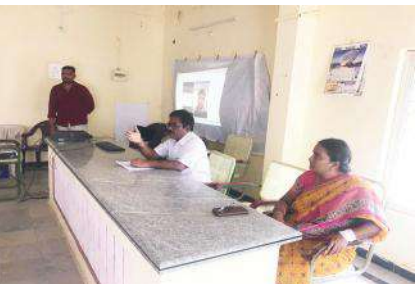
సమావేశంలో మాట్లాడుతున్న ఎంపిడివో

అవుకుమేజర్, న్యూస్: రాష్ట్ర ప్రభుత్వం ప్రతిష్టాత్మకముగా చేపడుతున్న సమగ్ర కులగణన నవంబరు 27 నుండి జరగబోయే కార్యక్రమాన్ని వాలంటీర్ల ద్వారా విజయవంతంగా జరిగేలా చూడేలా సచివాలయ సిబ్బంది కృషి చేయాలని ఎంపిడివో తెలియజేశారు. 27 నుండి ప్రారంభమయ్యే సమగ్ర కుల గణన కార్యక్రమంలో భాగంగా బుధవారము సచివాలయ సిబ్బందికి మరియు వాలంటీర్లకు శిక్షణా కార్యక్రమము నిర్వహించడమైనది. గ్రామ వాలంటీర్ల సచివాలయ సిబ్బందికి ఇంటింటికి తిరిగి ప్రతి కుటుంబ సభ్యుల వివరములు నమోదు చేయాలన్నారు. కులగణనలో ఎలాంటి అవకతవకలు జరగకుండా పటిష్టంగా అమలు చేయాలని సచివాలయ సిబ్బందికి సూచించడం జరిగింది. ఈ కార్యక్రమంలో ఎంపిడివో, ఈ.వో, పంచాయితీ కార్యదర్శులు, సచివాలయ సిబ్బంది మరియు వాలంటీర్లు హాజరయ్యారు.