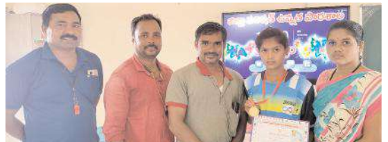
బాలికను అభినందిస్తున్న ఉపాధ్యాయులు, తల్లిదండ్రులు

వైసీపీ ప్రభుత్వం సామాజిక సాధికార బస్సు యాత్ర చేపడుతుందని అందులో భాగంగా పార్లమెంట్ పరిధిలోని బనగానపల్లె ఆసెంబ్లీలో 24వ తేదీన శ్రీశైలం ఆసెంబ్లీ నియోజకవర్గంలో బస్సు యాత్ర చేపడుతున్నారన్నారు. డాక్టర్ బి ఆర్ అంబేద్కర్ రాజ్యాంగం ప్రకారం న్యాయం చేయాలనే గాని తన సామాజిక వర్గానికి సీట్లు కేటాయించడం సామాజిక న్యాయమా అన్నారు. బీసీల్లో యాదవ, వడ్డెర, ఉప్పరి, బెన్న, బోయ, కమ్మరి, కుమ్మరి, రజక, విశ్వప్రాణ్ణా, ముస్లిం, ధళిత సంఘాలతో పాటు అన్ని కులాలు ఉన్నారు. అయితే అన్ని కార్పొరేషన్ లో, చైర్మన్లుగా ఎక్కువ భాగం రెడ్డి సామాజిక వర్గానికే కేటాయించారన్నారు. ఏమని సామాజిక సాధికార బస్సు యాత్ర చేపడుతున్నారని ప్రశ్నించారు.