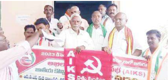
తహసీల్దారు కార్యాలయం ముందు ధర్మా నిర్వహిస్తున్న దృశ్యం

స్థానిక తహసీల్దార్ కార్యాలయం ముందు అఖిలపక్ష పార్టీల ధర్మా