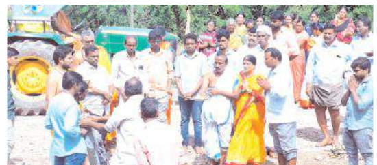
అమ్మవారి విగ్రహాలకు పూజలు చేస్తున్న దృశ్యం