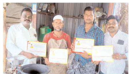
కరపత్రాలను ఇచ్చి ప్రచారం చేస్తున్న టీడీపీ నాయకులు