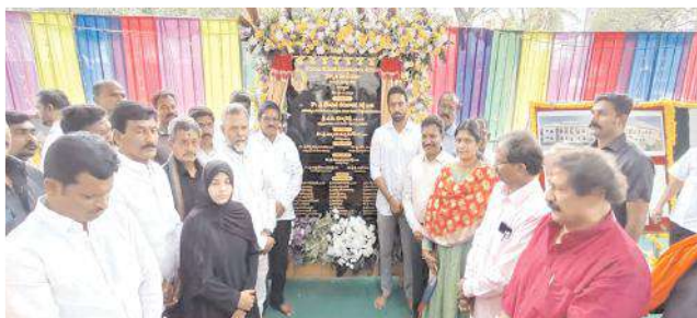
శిలాఫలకానికి శంకుస్థాపన చేసిన దృశ్యం

తెచ్చామని దీనితో ఆయన స్పందించి నిర్మాణానికి భూమిపూజ చేయడం సంతోషంగా ఉందన్నారు. తాము పట్టణంలో ఎంతో విలువ చేసే చాలికల జూనియర్ కళాశాలకు కూడా స్థలాన్ని దానం చేసినట్లు తెలిపారు. ఎమ్మెల్యే ఇసాక్ బాషా మాట్లాడుతూ