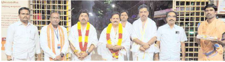
మధ్యప్రదేశ్ మంత్రికి స్వాగతం పలుకుతున్న ధృశ్యం