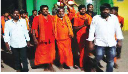
అక్షింతలను ఊరేగింపుగా తీసుకెళ్తున్న మాలాధారులు