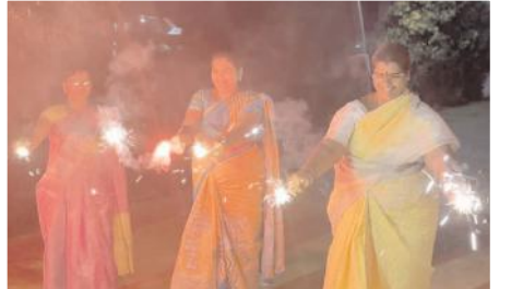
ఆనందోత్సవాలతో దీపావళి పండుగను చేసుకుంటున్న మహిళలు

మరుసటి రోజు నుంచి కార్తీక మాసం ప్రారంభం అవుతుండడంతో చాలా మంది దీక్షలు స్వీకరించారు. మంగళవారం ఉదయం నుంచి కార్తీక మాసం ప్రారంభమవుతుందని పండితులు పేర్కొనడంతో భక్తులు తెల్లవారుజామున లేచి చన్నీటి స్నానాలు ఆచరించి తమ ఇష్టమైన ఆలయాలకు వెళ్ళి దీపాలను వెలిగిస్తారు. నెల