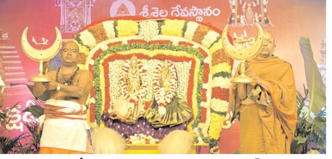
కృష్ణవేణిమ్మ తల్లికి దశవిధ హారతులు ఇస్తున్న ధృత్యం (ఫైల్)