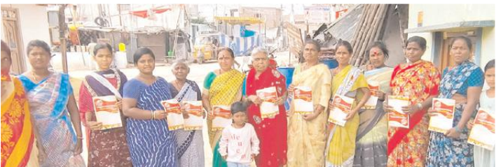
కరపత్రాలను విడుదల చేస్తున్న ఏపి మహిళా జిల్లా ఉపాధ్యక్షురాలు