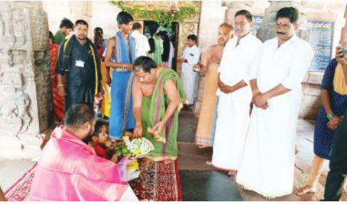
యాగంటి క్షేత్రంలో ఆళ్లగడ్డ ఎమ్మెల్యే