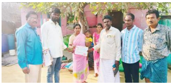
ప్రజలకు టీడీపీ మేనిఫెస్టోను అందజేస్తున్న టీడీపీ నాయకులు

-కౌతాళంలో 'బాబు ష్యూరిటీ- భవిష్యత్తుకు గ్యారెంటీ' కార్యక్రమం