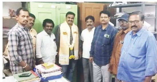
పోస్టల్ ఇన్స్పెక్టర్తో జిడిఎస్ నాయకులు

ఎమ్మిగనూరు టౌన్, మేజర్ న్యూస్ : ఎమ్మిగనూరు నూతన పోస్టల్ ఇన్