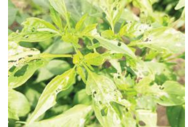
మిరప పంటను ఆశించిన పచ్చపురుగు పంటకు రైతులు సస్యరక్షణ చర్యలు వెంటనే చేపట్టాలని కోరారు. తామర పువ్వులు, పచ్చ రబ్బరు పురుగు, కొంచెం బూడిద తెగలు

- ఏడీఏ -500 ఎకరాల్లో ఆశించిన పచ్చపురుగు గోనెగండ్ల మేజర్ న్యూఢిల్లీ :