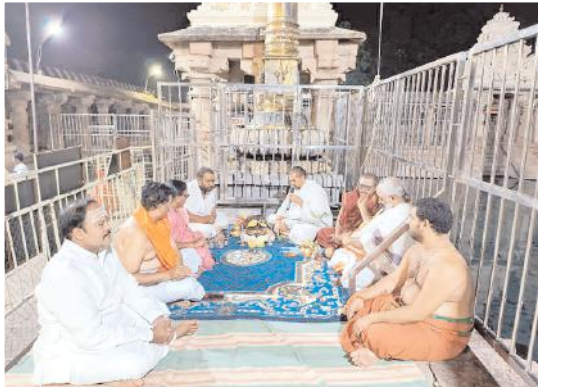
పూజలు నిర్వహిస్తున్న దృశ్యాలు