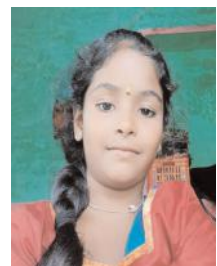
మల్లిక (ఫ్రెండ్ ఫోలో) గొంతుకు బిగుసుకొని ఉరి పడి చనిపోయిందని తెలిపారు. సంఘటన జరిగిన ఇంట్లో ఎవరూ లేరని వారు తెలిపారు. ఆ సమయంలో తల్లి పొలం పనులకు వెళ్లిందని, తండ్రి పెద్ద కుమారుడిని తీసుకొని ఆసుపత్రికి వెళ్ళారని వారు తెలిపారు. కుటుంబ సభ్యుల ఫిర్యాదు మేరకు కేసు నమోదు చేసుకొని దర్యాప్తు చేస్తున్నట్లు తెలిపారు.

సోకినట్లు వారు తెలిపారు. పచ్చ రబ్బరు పురుగుకు పుక్కామెటమైడ్ 16మిల్లీ/లను 20 లీటర్ల నీటిలో కలిపి పిచికారి చేయాలన్నారు. అలాగే బూడిద రంగు పురుగుకు అజాక్విస్టోలిన్ 10మిల్లీ/20 లీటర్లు నీరు కలిపి పిచికారి చేయాలి. ఈ పురుగు తెగుళ్ల పూర్తి అదుపుకు బవేరియా, వర్మీసీలియం, సూడో మోనాస్ ఒకొక్కటి 100మిల్లీ/20 లీటర్ల నీటిలో పంపుకు కలిపి అందులో ప్రతి పంపుకు 200 గ్రాముల బెల్లం కరిగించి నీరు పోసి పిచికారి చేయాలని రైతులకు సూచించారు.