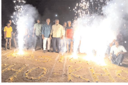
దీపాలతో ఖో-ఖో క్రీడా ప్రాంగణం