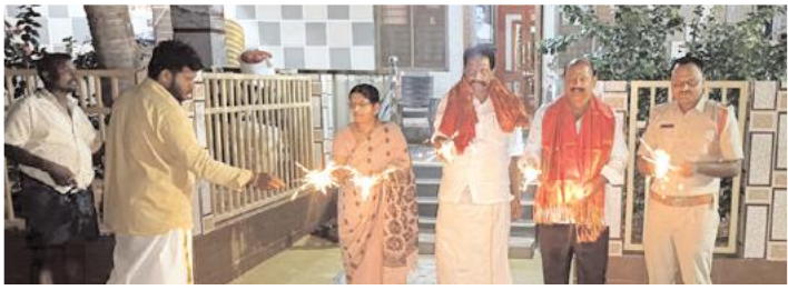
బాణసంచ కాల్పుతున్న ఎమ్మెల్యే