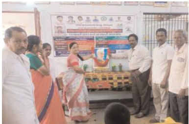
నెహ్రూ చిత్రపటానికి పూలమాలలు వేస్తున్న దృశ్యం