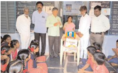
నెహ్రూ చిత్రపటానికి నివాళులు అర్పిస్తున్న అధికారి, పాఠకులు