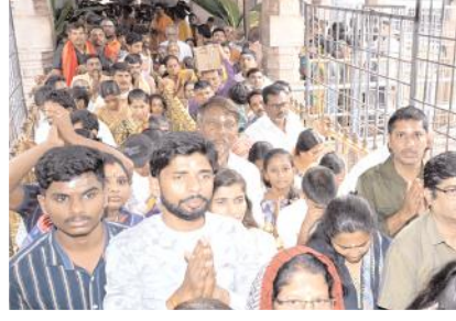
శ్రీశైలం మల్లన్న దర్శనం కోసం క్యూ కట్టిన భక్త జనం

అల్పహారం అందజేయబడుతున్నాయి. భక్తులందరికీ సౌకర్యవంతమైన దర్శనం కల్పించేందుకు వీలుగా కార్తికమాసంలో శ్రీస్వామివారి గర్భాలయ ఆర్జిత అభిషేకాలు, సామూహిక ఆర్జిత అభిషేకాలు నిలుపుదల చేయ బడ్డాయి. అదేవిధంగా భక్తులు రద్దీకోజులలో ( మొత్తం కార్తికమాసం 13 రోజులు) శ్రీస్వామివార్ల స్వర్ణదర్శనం కూడా నిలుపుదల చేయబడింది. ఈ రోజులలో భక్తులకు అలంకార దర్శనం మాత్రమే కల్పించడం జరుగుతుంది. కాగా సాధారణ రోజులలో రోజుకు నాలుగు విడతలు శ్రీస్వామివారి స్వర్ణదర్శనానికి వీలు కల్పించబడింది. ఈ స్వామి స్వర్ణదర్శనం టికెట్లు కేవలం ఆన్లైన్ మాత్రమే అందుబాటులో ఉంటాయి.