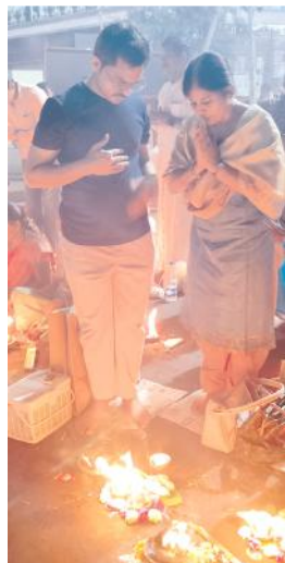
కార్తిక దీపమా అందుకో మా నమస్సులు... అందించు అశీర్వాదాలు

లక్షదీపోత్సవం, పుష్పరిణి హారతి, కార్తికపౌర్ణమిరోజున జ్వాలాతోరణోత్సవం, సదీహారతి మొదలైన వాటికి సంబంధించి పలు ఏర్పాట్లు చేయబడుతున్నాయి. సిబ్బందికి ప్రత్యేక విధులు : భక్తులకు సేవలు అందించేందుకుగాను కార్తికమాసంలో రద్దీకోజులందు కార్యాలయ సిబ్బందికి ప్రత్యేక విధులు కేటాయించబడ్డాయి. దర్శన ఏర్పాట్లు : వేకువజామున 3 గంటలకు ఆలయద్వారాలు తెరచి, ప్రాతఃకాల పూజల అనంతరం వేకువజామున 4.30 నుంచి సాయంకాలం గం. 4.00ల వరకు దర్శనాలు కల్పించబడుతున్నాయి. అదేవిధంగా తిరిగి సాయంత్రం గం. 5.30ల నుంచి రాత్రి గం. 11.00ల వరకు దర్శనాలు కొనసాగుతాయి. రెండు విడతలుగా ఆర్జిత చండీ హోమము మరియు రుద్రహోమం జరిపించబడుతాయి. క్యూ కాంప్లెక్స్ లోని భక్తులకు నిరంతరం మంచినీరు,