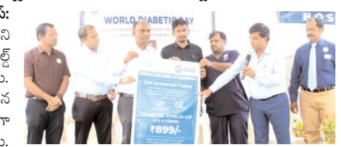
వార్షికోత్సవ విడుదల చేస్తున్న దృశ్యం

కర్నూలు రూరల్, మేజర్ న్యూస్: నగరంలోని జెమ్ కేర్ కామినేని హాస్పిటల్లో మంగళవారం వరల్డ్ డయాబెటిస్ డేను నిర్వహించారు. పుగర్ వ్యాధి పట్ల అవగాహన కల్పించారు. 200 మందికిపైగా ఉచిత పుగర్ పరీక్షలు చేశారు. అనంతరం డాక్టర్ ఎస్.వి.చంద్ర