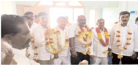
ఎన్నికైన నంద్యాల జిల్లా శాలివాహన సంక్షేమ సంఘం సభ్యులు

నంద్యాల రూరల్, మేజర్ న్యూస్ : నంద్యాల పట్టణంలోని భగత్ సింగ్ కాలనీలో ఉన్న శాలివాహన సంక్షేమ సంఘం కార్యాలయంలో నంద్యాల జిల్లా శాలివాహన సంక్షేమ సంఘంను రాష్ట్ర శాలివాహన సంక్షేమ సంఘం అధ్యక్షులు