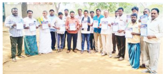
మహాసభ కరపత్రాలను విడుదల చేస్తున్న ఎమ్మార్పిఎస్ నాయకులు