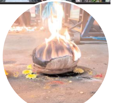
శ్రీశైలం లో వెలుగులు చిందిస్తున్న కార్తీక దీపం

కార్తీక మాసోత్సవాలు మంగళవారం రోజు నుండి ప్రారంభమయ్యాయి. ఈ కార్తీకమాసోత్సవ నిర్వహణకు వివిధ విస్తృత ఏర్పాట్లు చేయబడ్డాయి. భక్తులకు వసతి, మంచినీటి సరఫరా, సౌకర్యవంతమైన దర్శనం, స్వామి అమ్మవార్ల ఆర్జితసేవలు, పారిశుధ్యం, సోమవారాలు, మిగతా 2లో