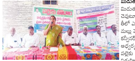
సంక్షేమ పథకాలు వివరిస్తున్న దృశ్యం