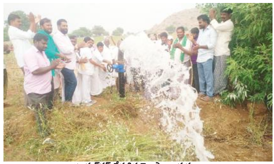
ట్రయల్ రన్ చేపట్టిన వైకాపా నాయకులు