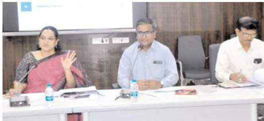
మాట్లాడుతున్న జిల్లా కలెక్టర్ జి.నృజన