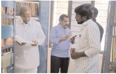
గ్రంథాలయంలో ఉన్న పుస్తకాలను చూస్తున్న ఎమ్మెల్యే ఎర్రకోట

గ్రంథాలయాన్ని తనిఖీ చేసిన ఎమ్మెల్యే ఎర్రకోట