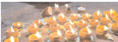
పవిత్ర కార్తీక మాస ప్రత్యేకత ఈ దీపపు కాంతులు