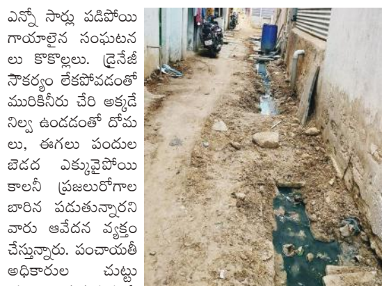
అస్తవ్యస్తమైన డ్రైనేజీ ఎన్నో సార్లు పడిపోయి గాయాలైన సంఘటనలు కొకొకటి. డ్రైనేజీ సౌకర్యం లేకపోవడంతో మురికినీరు చేరి అక్కడే నిల్వ ఉండడంతో దోమలు, ఈగలు పండుల బెడద ఎక్కువైపోయి కాలనీ ప్రజలు రోగాల బారిన పడుతున్నారని వారు ఆవేదన వ్యక్తం చేస్తున్నారు. పంచాయతీ అధికారుల చుట్టు ప్రజలు తిరుగుతున్న ఏ మాత్రం పట్టించుకోకుండా నిర్లక్ష్యంగా వ్యవహరిస్తున్నారన్నారు. పంచాయతీ అధికారులు మాత్రం ఇంటిపన్ను, కొకాయి పన్ను వంటి బిల్లులు మాత్రం సకాలంలో కట్టించుకుంటున్నారని, కానీ కాలనీ ప్రజల బాధలు మాత్రం పట్టించుకోవడం లేదని వాపోయారు. ఇప్పటికైనా అధికారులు స్పందించి మా కాలనీకి రోడ్లు, డ్రైనేజీ సౌకర్యం, మౌళిక సదుపాయాలను కల్పించాలని కాలనీ ప్రజలు కోరుతున్నారు.

కాలనీలో అధ్వాన్న ఉన్న రోడ్లు పత్తికొండ టౌన్, మేజర్ న్యూస్ : స్థానిక పట్టణంలోని 18వ వార్డు కుమ్మరివిధిలో రోడ్లు, డ్రైనేజీ ఉండడంతో ఎన్నో అవస్థలు ఏర్పడుతున్నట్లు ఆ కాలనీ ప్రజలు వాపోయారు. అధికారులు రోడ్లు వేస్తామని చెప్పి ఇంత వరకు పనులు మొదలు పెట్టడం లేదని, కేవలం పనులకు కావాల్సిన మెటీరియల్స్ మాత్రమే నిల్వ ఉంచి ఇంత వరకైనా పట్టించుకోకపోవడం అధికారుల నిర్లక్ష్యానికి నిదర్శనమని కాలనీ ప్రజలు విమర్శించారు. రోడ్లు, డ్రైనేజీ ఏర్పాటు చేస్తామని గతంలో ఉన్న రోడ్డును తప్పడంతో రోడ్లు, డ్రైనేజీ అస్తవ్యస్తంగా తయారైపోయింది. అధ్వాన్నంగా ఉన్న రోడ్డు నడవడానికి కూడ ఇబ్బందికరంగా మారి పోయి పిల్లలు, వృద్ధులు