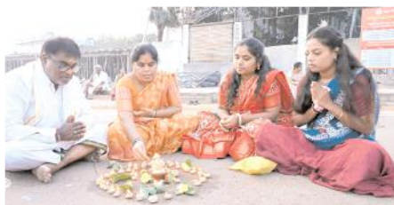
కార్తీకదీపాలు వెలిగిస్తున్న భక్తులు