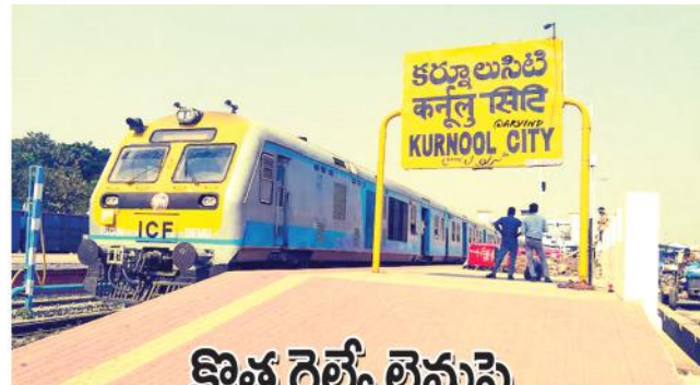
కొత్త రైల్వే లైనుపై