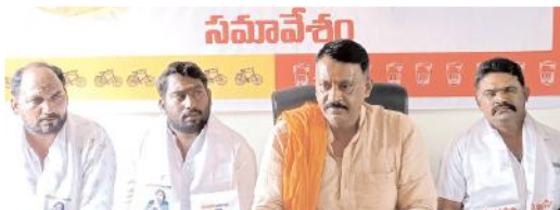
పాత్రికేయుల సమావేశంలో మాట్లాడుతున్న మాజీ ఎమ్మెల్యే బుడ్డా

వైసిపి పాలనలో ప్రజలు విసుగు చెందారని, సంక్షేమాభివృద్ధి అంటూనే రాష్ట్ర ప్రజలను ముప్పు తిప్పలు పెడుతున్నారని అన్నారు. ఓటమి భయంతోనే పార్టీ కోసం పనిచేయకపోయినా, పార్టీలో చేరకపోయినా ఉద్యోగాలు తీసిస్తాం, పథకాలను, పంచనలు రాకుండా చేస్తామంటూ బెదిరింపులకు పాల్పడుతున్నారని అన్నారు. ఇప్పటికే వైసిపికి ఓటమి మొదలైందని, టిడిపిలోకి స్వచ్ఛందంగా వైసిపి నాయకులు, కార్యకర్తలు వచ్చి చేరుతున్నారని అన్నారు. వైసిపి నుంచి టిడిపిలో చేరిక