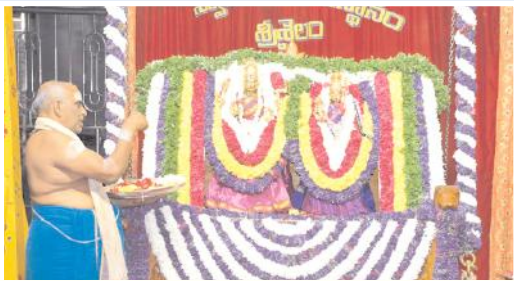
5. ఊయల సేవలో స్వామి, అమ్మవార్లు