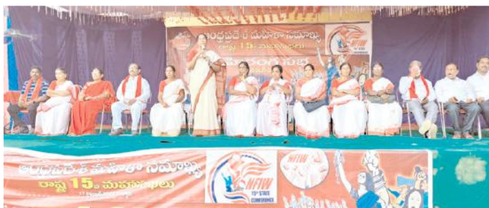
మహిళా సమాఖ్య జాతీయ నాయకురాలు అక్కినేని వసజ మాట్లాడుతున్న దృశ్యం