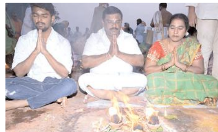
కార్తీకదీపాలు వెలిగిస్తున్న భక్తులు