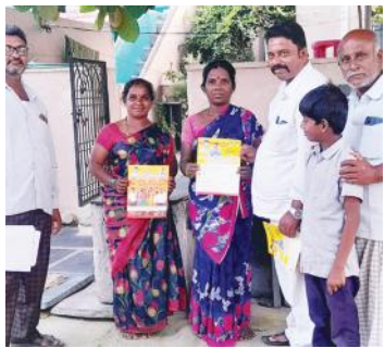
కరపత్రాలు పంపిణీ చేస్తున్న దృశ్యం

బనగానపల్లె మేజర్, న్యూస్: బనగానపల్లె పట్టణంలోని బూత్ నెం. 83, 96 కరెంటు ఆఫీసు ఏరియా మరియు సబ్ ఇంజనీరింగ్ ఆఫీసు ఏరియాల్లో బనగానపల్లె మాజీ ఎమ్మెల్యే బీసీ జనార్థన్ రెడ్డి ఆదేశాల మేరకు టీడీపీ మైనార్టీ అధ్యక్షులు రాయలసీమ సలాం ఆధ్వర్యంలో శుక్రవారం నా బాబు మ్యారిటీ - భవిష్యత్ గ్యారెంటీ కార్యక్రమాన్ని నిర్వహించి ప్రతి ఇంటికి తిరిగి తెలుగు దేశం పార్టీ అధికారంలోకి వస్తే అందించే సంక్షేమ పథకాలను తెలిపి కరపత్రాలను పంపిణీ చేసి ప్రతి ఒక్కరూ టీడీపీకి అండగా నిలవాలని కోరారు. ఈ కార్యక్రమంలో చంద్రారెడ్డి, జాకీర్ హుసేన్ బాబు తదితరులు పాల్గొన్నారు.