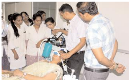
చికిత్స చేసే విధానాన్ని తెలుపుతున్న దృశ్యం

కర్నూలు ఎడ్యుకేషన్, మేజర్ న్యూస్: జి.పుల్లారెడ్డి దంత కళాశాలలో అధునాతన పీడియాట్రిక్ ఎన్ 20-02 సెడేషన్ యూనిట్ పీడియాట్రిక్ దంత విభాగంలో ప్రారంభించారు. ఇందులో పిల్లలు ఆహ్లాదంగా వారి దంత చికిత్సను చేయించుకునేందుకు వీలు ఉంటుంది. దంత చికిత్స భయం, ఆందోళన పిల్లలకు బాగా ఉపయోగపడుతుంది. ఈ అవకాశాన్ని ప్రజలు సద్వినియోగం చేసుకోవాలని యాజమాన్యం తెలిపింది.