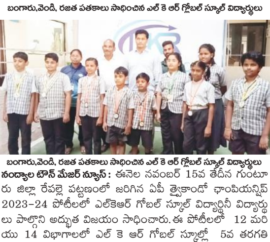
బంగారు, వెండి, రజత పతకాలు సాధించిన ఎల్ కె ఆర్ గ్రోబల్ సూల్ విద్యార్థులు

బంగారు, వెండి, రజత పతకాలు సాధించిన ఎల్ కె ఆర్ గ్రోబల్ సూల్ విద్యార్థులు నంద్యాల టౌన్ మేజర్ న్యూస్ : ఈనెల నవంబర్ 15వ తేదీన గుంటూరు జిల్లా రేపల్లె పట్టణంలో జరిగిన ఏపీ ట్రైకాండ్ ఛాంపియన్షిప్ 2023-24 పోటీలలో ఎల్ కె ఆర్ గ్రోబల్ సూల్ విద్యార్థులు విద్యార్థులు పాల్గొని అద్భుత విజయం సాధించారు. ఈ పోటీలలో 12 మరియు 14 విభాగాలలో ఎల్ కె ఆర్ గ్రోబల్ సూల్లో 5వ తరగతి