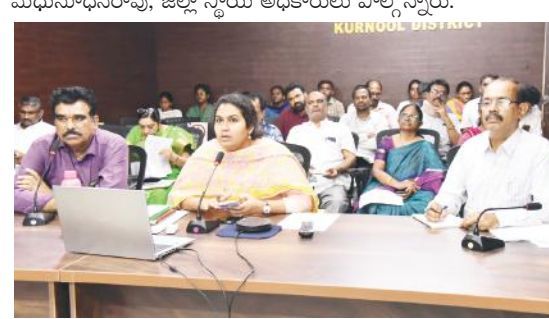
వీడియో కాన్ఫరెన్స్లో మాట్లాడుతున్న జేసీ

కర్నూలు, మేజర్ న్యూస్ ప్రతినిధి : పెండింగ్ ఉన్న ఫార్మ్స్ త్వరితగతిన ప్రాసెస్ చేయడంతోపాటు ప్రాసెస్ వాటిని 7రోజుల్లోపు డిస్పోజ్ చేసేలా చర్యలు తీసుకోవాలని జాయింట్ కలెక్టర్ నారపురెడ్డి మార్కెట్ మండల స్థాయి అధికారులను ఆదేశించారు. శుక్రవారం కలెక్టరేట్ వీడియో కాన్ఫరెన్స్ హాల్ నుంచి వివిధ ప్రభుత్వ అంశాలపై జిల్లా స్థాయి అధికారులు, వీడియో కాన్ఫరెన్స్ ద్వారా మండల స్థాయి అధికారులతో జేసీ సమీక్ష సమావేశం నిర్వహించారు. ఈ సందర్భంగా ఆమె మాట్లాడుతూ అణములీస్, జంకె క్యారెక్టర్స్, ఫోలో సిమిలర్ ఎంట్రీస్, డేమా గ్రాఫిక్ ఎంట్రీలను పూర్తి స్థాయిలో పరిశీలించాలన్నారు. సెక్టోరల్ ఆఫీసర్లు వారి రూట్లను చెక్ చేసుకోవాలన్నారు. రీ సర్వేకు సంబంధించి పెండింగ్ ఉన్న స్టాన్ ఫ్లాంటేషన్లను త్వరగా పూర్తి చేయాలన్నారు. డిఆర్ఓ