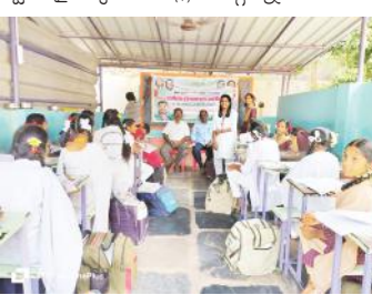
స్వాతంత్ర్య ఉద్యమంపై ఉపన్యాసం ఇస్తున్న విద్యార్థులు