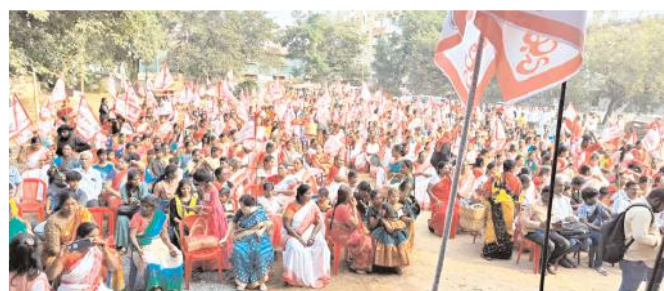
మహాప్రదర్శనకు భారీగా హాజరైన మహిళలు

నిర్వీర్యం చేస్తున్నదని విశాఖ ఉక్కు ఫ్యాక్టరీని ప్రైవేటీకరణ చేయాలని చూడడం అత్యంత దురదృష్టకరమన్నారు. కేంద్ర ప్రభుత్వం రూ.25లక్షల కోట్లను కార్పొరేట్ రుణాలను రద్దు చేయడం దుర్మార్గం అన్నారు. మోడీ, అమిత్ షాలు ఆదాని, అంబానీలకు దేశంలోని ప్రభుత్వ రంగ సంస్థలను అప్పుసంగా అప్పుచెబుతున్నారని విమర్శించారు. మహిళల రక్షణ కోసం కేంద్ర, రాష్ట్ర ప్రభుత్వాలు ఎటువంటి చర్యలు తీసుకోవడం లేదన్నారు. మహిళలు పోరాటాలకు సిద్ధం కావాలని పిలుపునిచ్చారు. సీపీఐ రాష్ట్ర సహ కార్యదర్శి నాగేశ్వరరావు మాట్లాడుతూ భారతదేశ భవిష్యత్తు ఒకవైపు యువత మరోవైపు మహిళలపై ఆధారపడి ఉందన్నారు. సతిసహగమన