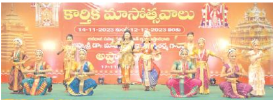
కూచిపూడి స్వస్థ్యం చేస్తున్న కళాకారులు

అది దంపతులకు కన్నుల పండువగా ఊయల సేవ లోక కళ్యాణం కోసం శ్రీశైల భ్రమరాంబ మల్లికార్జున శ్రీస్వామి, అమృవార్లకు శుక్రవారం రాత్రి ఊయల సేవను వైభవంగా నిర్వహించారు. ప్రతి శుక్రవారం, పౌర్ణమి, మూల నక్షత్రం రోజులలో ఈ ఊయల సేవ జరిపించబడుతోంది. ఈ కార్యక్రమంలో భాగంగా