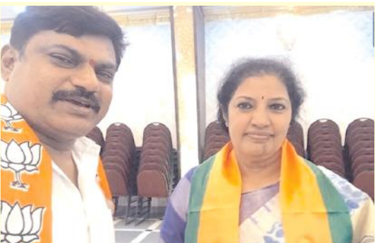
పురందేశ్వరితో అభిరుచి మధు

కర్నూలు, సూర్య ప్రతినిధి: కర్నూలు నుంచి నంద్యాల మార్గంలో కొత్త రైల్వే లైను నిర్మాణంపై రెండు జిల్లా ప్రజలు కోటి ఆశలు పెట్టుకున్నారు. ఈ రైల్వే లైను నిర్మాణం పూర్తయితే అభివృద్ధి శరవేగంగా జరుగుతుందని భావిస్తున్నారు. అంతేగాక ప్రయాణీకులకు కూడా ఈ లైను ఎంతో ఉపయోగంగా ఉంటుందని ఆశిస్తున్నారు. కర్నూలు నుంచి నంద్యాల వరకు ఓర్వకల్లు మీదుగా కొత్త రైల్వే లైను నిర్మించాలని రైల్వే శాఖ ఉన్నతాధికారులు నిర్ణయించారు. ఈ మేరకు కేంద్ర ప్రభుత్వానికి వారు ప్రతిపాదనలు పంపగా