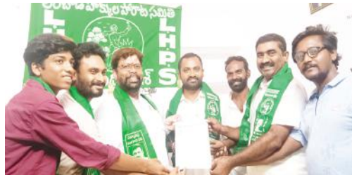
నియామక పత్రాలు అందజేస్తున్న దృశ్యం