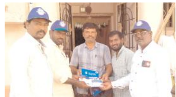
బుకెట్లను అందజేస్తున్న వైసీపీ నాయకులు