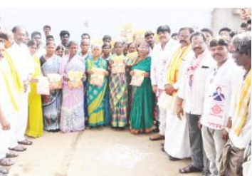
కరపత్రాలను పంపిణీ చేస్తున్న మాజీ ఎమ్మెల్యే