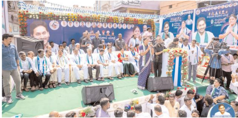
సమావేశంలో మాట్లాడుతున్న ఎమ్మెల్యే

యాత్రకు స్వాగతం పలికారు. అణగారిన వర్గాలకు అభివృద్ధి, సహకారం, అందించే నేత దేశంలో ఎవరైనా