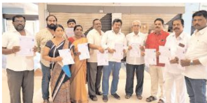
కరవత్రం అందజేస్తున్న దృశ్యం