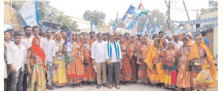
తరలివెళ్తున్న వైసీపీ నాయకులు