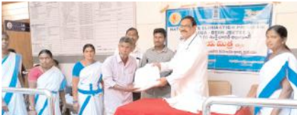
కిట్లను పంపిణీ చేస్తున్న దృశ్యం

- పవర్ గ్రీడ్ సంస్థ ప్రత్యేక న్యూట్రిషన్ కిట్లు