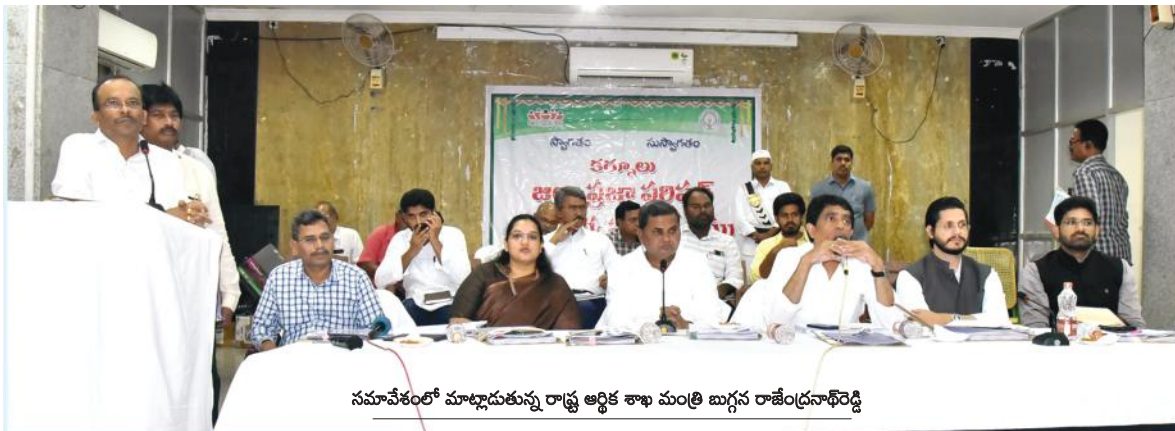
సమావేశంలో మాట్లాడుతున్న రాష్ట్ర ఆర్థిక శాఖ మంత్రి బుగ్గన రాజేంద్రనాథ్ రెడ్డి