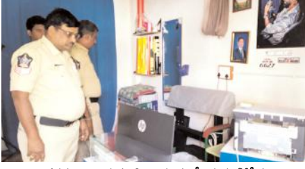
దొంగతనం జరిగిన స్టూడియోను పరిశీలిస్తున్న పోలీసులు

రాకపోవడంతో పట్టణంలో ఆకతాయిల ఆగడాలకు అడ్డా అందుతున్న పోయింది. గత రెండు నెలల క్రితం కొత్త బస్టాండు ఆవరణలో కొన్ని కిరాణి దుకాణాలలో చోరీలు చేసి సిగరెట్లు, కొంతనగదును అపహరించారు. శుక్రవారం రాత్రి పట్టణంలో ప్రధాన రహదారిలో ఉన్న కొన్ని దుకాణాల తాళాలు పగలగొట్టి కొంత సొమ్మును అపహరించారు. చర్చికి సమీపంలో ఉన్న పోలో స్టూడియోలో నగదు 30వేలు,