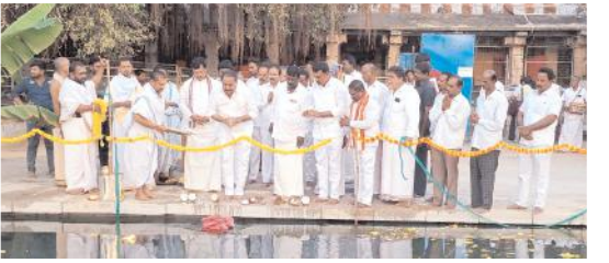
మహానంది క్షేత్రంలో పుష్కరిణిని ప్రారంభిస్తున్న ఎమ్మెల్యే

- మినీ కళ్యాణ మండపం నిర్మాణానికి శంకుస్థాపన