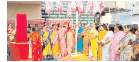
జెండా ఆవిష్కరిస్తున్న దృశ్యం