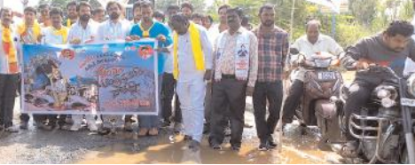
నిరసన తెలుపుతున్న టీడీపీ, జనసేన నాయకులు

ప్రజలు ప్రమాదాల బారిన పడతారన్నారు. వచ్చే ఎన్నికల్లో చంద్రబాబు ముఖ్యమంత్రి అయితే రాష్ట్రంలో డెవలప్ మెంట్ ఉంటుందన్నారు. టీడీపీ, జనసేన ప్రభుత్వంలో ప్రజలకు మంచి పరిపాలన అందుతుందన్నారు.