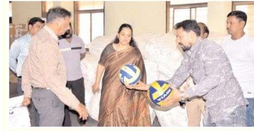
స్పోర్ట్స్ కిట్స్ను పరిశీలిస్తున్న కలెక్టర్