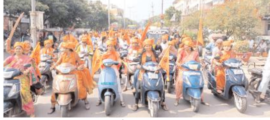
స్కూటర్ ర్యాలీ నిర్వహిస్తున్న దృశ్యం