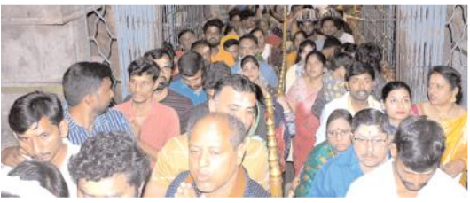
భక్తులతో కిక్కిరిసిన క్యాలనైన్సు

శ్రీశైలం, మేజర్ న్యూస్: ఇల కైలాసమైన శ్రీశైల మహాక్షేత్రంలో కార్మిక రద్దీ నెలకొంది. కార్మికమాసాన్ని పురస్కరించుకుని మొదటి శనివారం ఉభయ తెలుగు రాష్ట్రాల నుంచే కాకుండా ఇతర రాష్ట్రాల నుంచి సైతం భక్తులు వేలాదిగా తరలివచ్చారు. వేకువజామున పాతాళగంగలో పుణ్యస్నానాలు ఆచరించిన భక్తులు స్వామి, అమ్మవార్ల దర్శనానికి బారులు తీరారు. భక్తుల రద్దీతో ఆలయ క్యాలనైన్సీ నిండిపోయాయి. భక్తుల శివనా మస్కరణతో ఆలయ ప్రాంగణం మరింత ఆధ్యాత్మికతను సంతరించుకుంది. భక్తుల రద్దీతో ఆలయ పురవీధులన్ని కిటకిటలాడాయి. రద్దీ నేపథ్యంలో స్వామి, అమ్మవార్ల దర్శనాలు, ఆర్జిత సేవల్లో ఎలాంటి ఇబ్బందులు లేకుండా దేవస్థానం అధికారులు ముందస్తు ప్రణాళికను అమలు చేశారు. ఉచిత, శీఘ్ర, అతిశీఘ్ర దర్శన క్యాలనైన్సు తెల్లవారుజాము నుంచే భక్తులతో నిండిపోయాయి. ఈ క్రమంలో స్వామి అమ్మవార్ల దర్శనానికి రెండు మూడు గంటలపాటు సమయం పట్టింది. ఆలయాల్లో తెల్లవారు జామున 3 గంటలకే ద్వారాలు తెరచి మంగళవాదులు ద్వారాలు, సుప్రభాత సేవ, ప్రాతః కాలపూజ, మహామంగళహారతి సేవలు నిర్వహించి తదుపరి 4.30