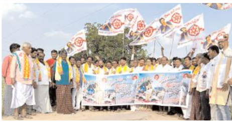
నిరసన తెలుపుతున్న దృశ్యం