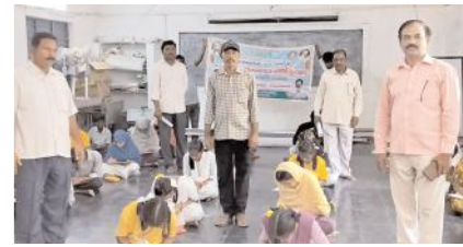
విద్యార్థులకు పోటీ పరీక్షలు నిర్వహిస్తున్న దృశ్యం

గడివేముల, మేజర్ న్యూస్ : గడివేముల గ్రంథాలయం శాఖయందు శనివారం 56వ జాతీయ గ్రంథాలయం వారోత్సవాలలో భాగంగా గడివేముల