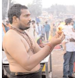
కార్మిక దీపాలను వెలిగిస్తున్న భక్తులు

గంటల నుంచే స్వామి అమ్మవార్ల దర్శనాలకు వీలు కల్పించారు. ప్రతి సోమవారం ఆలయ పుష్కరిణి వద్ద లక్ష్మీ దీపోత్సవం, పుష్కరిణి హారతిని కన్నుల పండవగా నిర్వహించుచున్నారు.