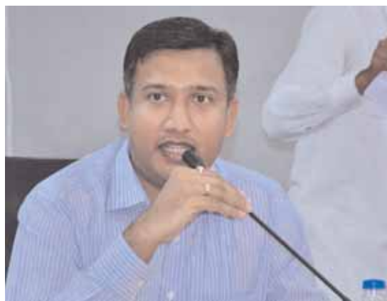
నిర్వహిస్తున్న సిబ్బంది వివిధ కారణాలతో తమ ఓటును వినియోగించుకోలేని సిబ్బందికి ఓటు వేసు కునే అవకాశం పోస్టల్ బ్యాలెట్ ఓటును వినియోగించుకోవచ్చని జిల్లా ఎన్నికల అధికారి/కలెక్టర్ రాజర్షి షా తెలిపారు.

మెదక్ మేజర్ న్యూస్ ప్రతినీధి ; జిల్లా లోని రెండు నియోజకవర్గాలలో ఎన్నికల విధులు నిర్వహిస్తున్న సిబ్బంది 3001 మంది ఓటర్లు తమ ఓటును వినియోగించుకున్నారని శనివారం జిల్లా ఎన్నికల అధికారి/కలెక్టర్ రాజర్షి షా తెలిపారు. జిల్లా సమీకృత కలెక్టర్ సముదాయములో ఏర్పాటు చేసిన పోస్టల్ బ్యాలెట్ పోలింగ్ కేంద్రంలో 241 , స్థానిక డిగ్రీ కళాశాల లో 411 , మెదక్ ఆర్ డి ఓ కార్యాలయములో ఏర్పాటుచేసిన పోలింగ్ కేంద్రంలో 133, నర్సాపూర్ ఆర్డీ ఓ కార్యాలయము లో 155 , ప్రభుత్వ జూనియర్ కాలేజ్ లో 490 మంది ఎన్నికలసిబ్బంది తమ ఓటు ను వినియోగించుకున్నారని తెలిపారు. నిన్నటి వరకు జిల్లా వ్యాప్తంగా రెండు నియోజకవర్గాలలో జరిగిన పోస్టల్ బ్యాలెట్ పోలింగ్ లో 1571 మంది ఓటర్లు వారి ఓటు హక్కు ను వినియోగించుకున్నారని ఈ రోజు 1430 మంది ఓటర్లు తమ ఓటును వినియోగించుకున్నారు మొత్తంగా జిల్లా లో శనివారం వరకు ఎన్నికలవిధులు నిర్వహిస్తున్న 3001 ఓటర్లు తమ ఓటు హక్కును వినియోగించుకున్నారని జిల్లా ఎన్నికల అధికారి రాజర్షి షా తెలిపారు. ఎన్నికలవిధులు