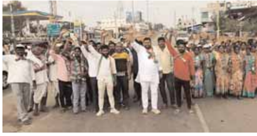
కాంగ్రెస్ పార్టీ జెండా ఎగరడం భాయమని అన్నారు కాంగ్రెస్ పార్టీకి జనాదరణ పెరుగుతుందని గ్రామాల నుండి భారీ సంఖ్యలో నాయకులు