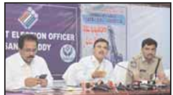
: జిల్లా కలెక్టర్ డాక్టర్ శరత్

పరిశ్రమలకు వేతనంతో కూడిన సెలవు దినంగా ప్రకటించారని కలెక్టర్ తెలిపారు. ఎన్నికల నిర్వహణలో భాగంగా ఈ నెల 29న కూడా సెలవు దినంగా ప్రకటిస్తూ, స్థానికంగా ఉత్తర్వులు జారీ చేశామని కలెక్టర్ తెలిపారు. జిల్లాలోని అన్ని ప్రభుత్వ, ప్రైవేటు పాఠశాలలు, విద్యా సంస్థలకు, ప్రభుత్వ సంస్థలకు నవంబర్ 29 మరియు 30 సెలవు దినంగా కలెక్టర్ పేర్కొన్నారు.