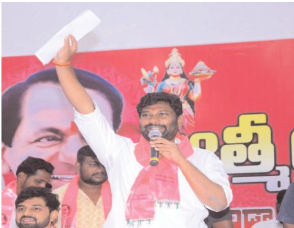
- ప్రభుత్వ విప్ బాల్క సుమన్

కామారెడ్డి, నవంబర్ 06, సూర్య :కేసీఆర్ లేకపోతే తెలంగాణ వచ్చేదా అని