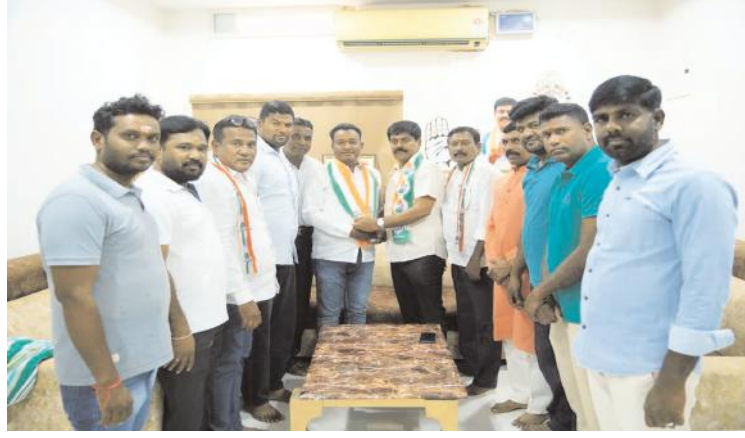
జంబి హనుమాన్ ఆలయ కమిటీ మాజీ చైర్మన్ కోగుల