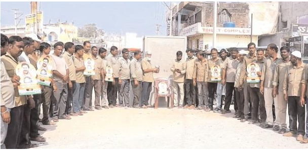
మాచారెడ్డి సూర్య మేజర్ న్యూస్ మాచారెడ్డి మండల కేంద్రంలో నిన్న కాంగ్రెస్ పార్టీ ప్రవేశపెట్టిన మేనిఫెస్టోపట్ల ఆకర్షితులై నా ఆటో డ్రైవర్ యూనియన్

అసోసియేషన్ మాచారెడ్డి సభ్యులు రేవంత్ రెడ్డి చిత్రపటానికి పాలాభిషేకం చేసి మాచారెడ్డి చౌరస్తా నుంచి చిన్న మల్లారెడ్డి వరకు 60 ఆటో లతో భారీ ర్యాలీ నిర్వహించారు ఈ సందర్భంగా ఆటో యూనియన్ లీడర్స్ మాట్లాడుతూ ఇప్పటికీ ఇన్ని ప్రభుత్వాల వచ్చి వెళ్లినవి కానీ అటు కార్మికుల కోసం ఆలోచించిన ప్రభుత్వం లేదు అని ఇప్పుడు కాంగ్రెస్ పార్టీ మేనిఫెస్టోలో ప్రతి ఆటో సభ్యునికి సంవత్సరానికి 12000 ప్రతి మేజర్ సీటిలో ఆటోనగర్ ఏర్పాటు సంక్షేమ బోర్డు మరియు ఇప్పటివరకు ఉన్న ట్రాఫిక్ ఛానల్ లపై 50 శాతం రాయితీ ప్రకటించడం పట్ల కార్మికులు హర్షం వ్యక్తం చేశారు ఇంత మేనిఫెస్టోను ప్రకటించిన కాంగ్రెస్ పార్టీకి మా సంపూర్ణ మద్దతు ప్రకటిస్తున్నట్లు యూనియన్ సభ్యులు తెలియజేశారు ఈ కార్యక్రమంలో మాచారెడ్డి ఆటో యూనియన్ అసోసియేషన్ సభ్యులు పాల్గొన్నారు