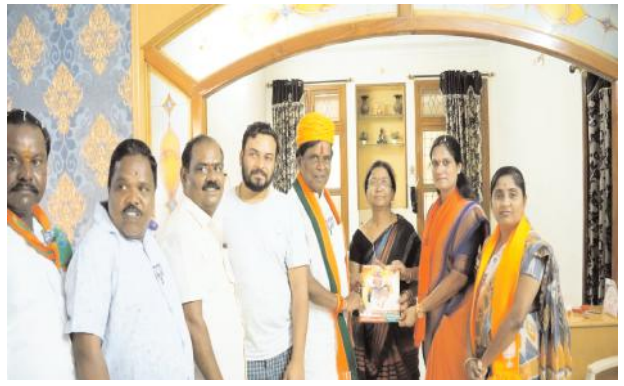
- బీజేపీ అభ్యర్థి