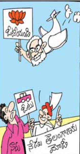
తెలంగాణ మీద ప్రేమా... లేక మిమ్మల్ని ఓడించాలనో...