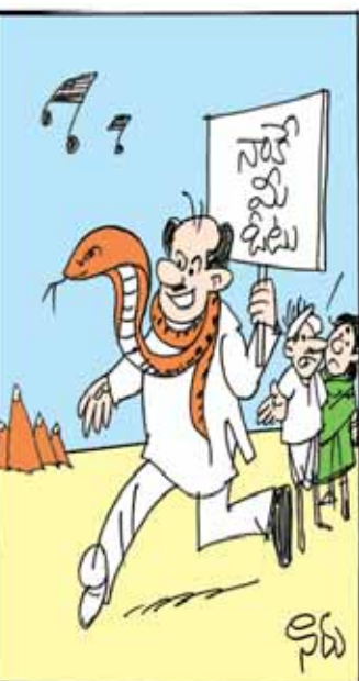
ఆయనది పాము గుర్తేమా...