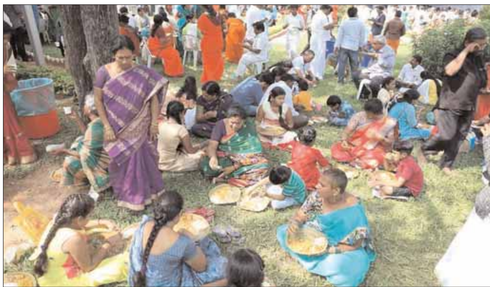
ప్రభావితం చేయగలిగిన సామాజికవర్గాలపై ప్రధాన రాజకీయ పార్టీలు ధూంపిస్తో సారించాయి. వివిధ ప్రాంతాల్లో ప్రస్తుతం జరుగుతున్న వన సమారాధనలను పరిశీలిస్తే ఆయా రాజకీయ పార్టీలు వెనుక ఉండి నడిపిస్తున్నట్లు స్పష్టమవుతోంది.

ప్రధాన రాజకీయ పార్టీలకు చెందిన నేతల కనుసన్నల్లో జరుగుతున్న వనభోజనాలు రాజకీయ రంగు వులుముకున్నాయి. ఏటా కార్తీకమాసంలో గోదావరి జిల్లాల్లో వన సమారాధనలు భారీగానే జరుగుతుంటాయి. ఆయా కులసంఘాల ఆధ్వర్యంలో కార్తీక వన భోజనాలను నిర్వహిస్తుంటాయి. అయితే 2023 తెలంగాణలో ఎన్నికలు సమీపిస్తుండటంతో కార్తీక వన సమారాధనలు మాటున ప్రధాన రాజకీయ పార్టీలు నూతన సమీకరణాలకు శ్రీకారం చుట్టాయి. ముఖ్యంగా ప్రధాన కులసంఘాలు వెనుక ఉండి బలాబాలను ప్రదర్శిస్తున్నాయి. దీంతో కార్తీక మాస వనభోజనాలు. కుల సమావేశాలకు నేతలు సిద్ధమవుతున్నారు. కార్తీక మాసంలో వనభోజనాలకు వెళ్లడం సంప్రదాయంగా వస్తుంది. సాధారణంగా స్నేహితులు, బంధువులు కలిసి వనభోజనాలకు వెళ్లి వస్తుంటారు. కార్తీక మాసంలో అందరూ కలుసుకుని తమ కుటుంబ సమస్యలను చెప్పుకోవడానికి వీటిని వేదికలుగా ఉపయోగించుకుంటారు. ఎక్కువ మంది ఈ వనభోజనాలతో ఆత్మీయ కలయికలుగా వాడుకున్నారు. అన్ని పార్టీలకు చెందిన అభ్యర్థులు తమ నియోజకవర్గం పరిధిలో ఈ వన భోజనాల ఏర్పాట్లకు రెడీ చేసుకుంటున్నారు. రాజకీయ పార్టీల నేతలు కులాల వారీగా జరుగుతున్న వన సమారాధనల వెనుక కీలక భూమిక పోషిస్తున్నారు. జిల్లాలో ఓటు బ్యాంకును తీవ్రంగా