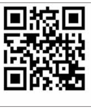
సూర్య ఈ - పేపర్

ఎదురులేని అటామో వన్ ప్రపంచ కప్ టోర్నమెంట్ పైనల్ చేరిన టీమిండియా ఆసీస్ ను ఓడించి ప్రపంచ కప్ మాత్రం తనదే చేసింది. మూడవ పర్యాయం ప్రపంచ కప్ గెలవాలన్న భారత్ ఆశలకు గండి పడింది. పైనల్ సోలో ఆస్ట్రేలియా జట్టు ఇంకా ఏడు ఓవర్లు మిగిలి ఉండగానే ఆరు వికెట్ల తేడాతో భారత్ ను ఓడించి ఆరవ సారి ప్రపంచ కప్ ను గెలుచుకుంది. 241 పరుగుల లక్ష్యంతో తమ ఇన్నింగ్స్ ను ప్రారంభించిన ఆస్ట్రేలియా ఏడు ఓవర్లలో 41 పరుగుల స్కోర్ లోపు మాడు వికెట్లు కోల్పోయింది. డేవిడ్ వార్నర్ 7, మిచెల్ మార్ 15, స్టీవ్ స్మిత్ 4 పరుగులకు అవుటయ్యారు. ఆ స్థితిలో ఓపెనర్ ట్రావిస్ హెడ్, ఐదవ సంఖ్య బ్యాట్స్ మన్ మార్నస్ లబుషేన్ తమ జట్టు ఇన్నింగ్స్ ను పునర్నిర్మించారు.