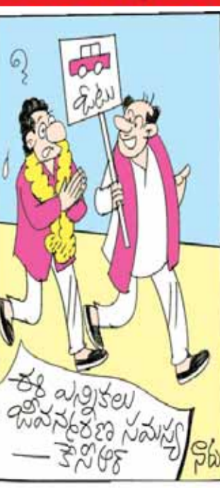
తెలంగాణ, మన పార్టీకా సార్