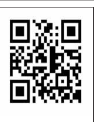
సూర్య వెబ్ సైట్