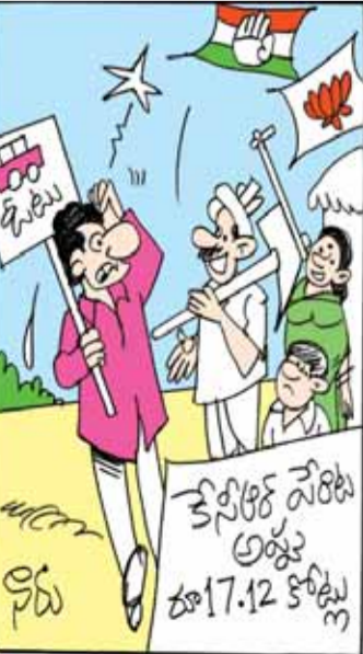
అప్పు తీర్చాలన్న ఫాంపాసాన్ అమ్మతారా సార్