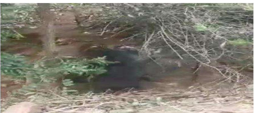
వలకు చిక్కుకున్న పిల్ల ఎలుగుబంటి వర్షన్నపేట నవంబర్ 29 మేజర్ న్యూస్ సూర్య